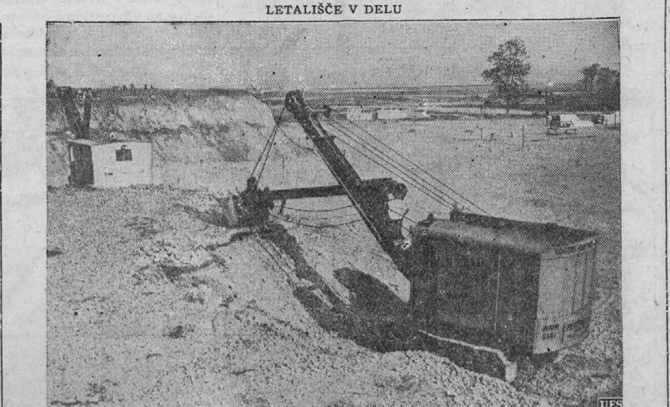
Najbolj razsežno letališče na celim svetu bo armadno letališče, ki se točasno gradi osem milj južno od Tacoma, Wash. Raztezalo se bo preko pet. milj in pod zemljo bodo zgrajeni hangerji za več tisoč bojnih aeroplanov, da bo na ta način to ena najbolj strateških obrambnih točk na severozapadu.