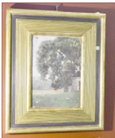
Zgoraj Pilonov Pogled čez most (50.000 do 70.000 evrov); levo Egon Schiele: Veliko drevo (60.000 evrov); spodaj Ivan Grohar: V Gerajtah (50.000 do 70.000 evrov)