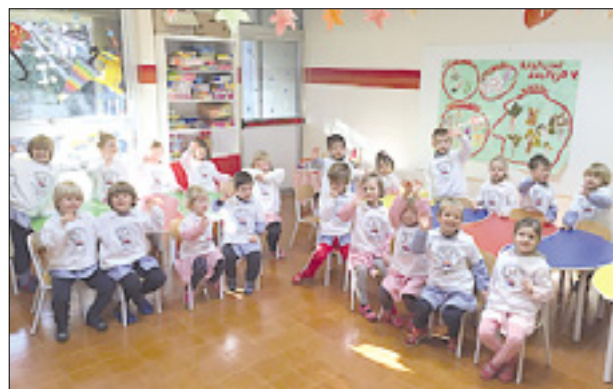
Otroci v novih majičkah ob novih mizah