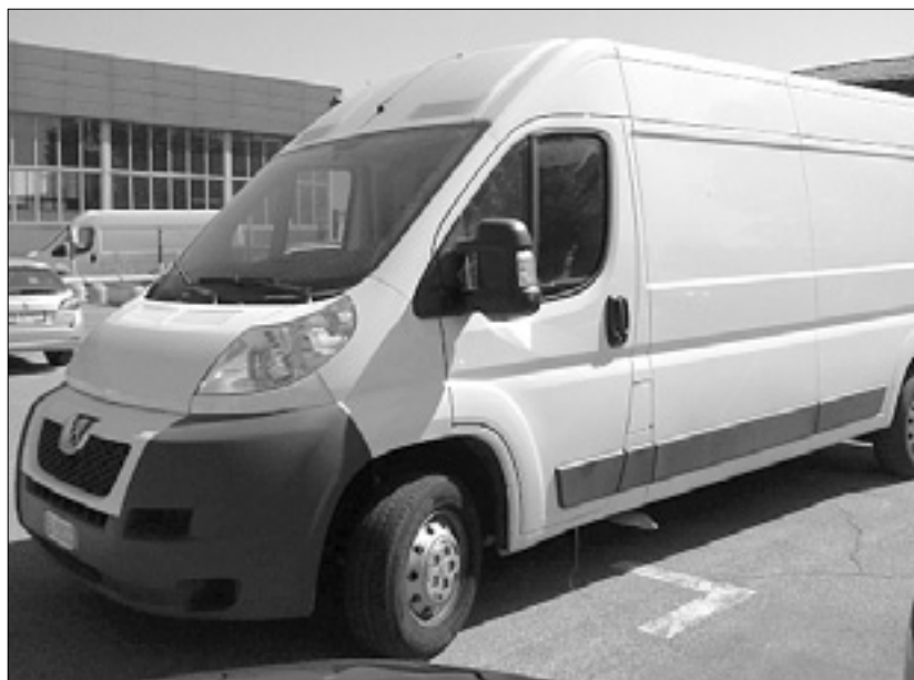
Peugeot boxer je bil poln ukradenega blaga

Možje v modrem so sklenili, da bodo moškega in žensko pospremili do goriškega poveljstva prometne policije. Med vožnjo je T.M. nenadno ustavil kombi, zapustil svojo sopotnico in se pognal v beg. Splezal je po brežini ob cesti in zatem izginil neznan kam. Policisti so mu sprva sledili, nato so se odločili, da bodo najprej pomagali ženski: avtomobil je bil namreč na nevarni točki, nosečnica pa je še vedno sedela v njem. Žensko so odpeljali na poveljstvo pro-