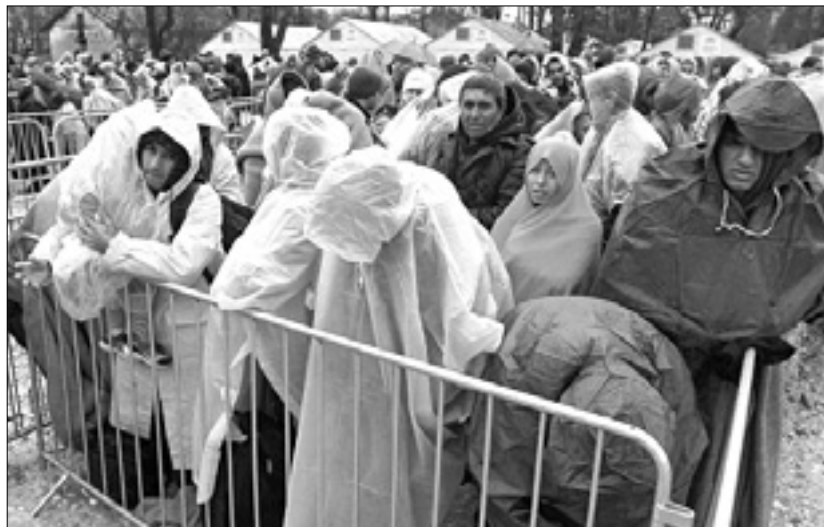
Begunci v dežju včeraj v sprejemnem centru v Preševu na jugu Srbije

Prefektnja je citirala knjigo demografa Massima Livija Baccija Il Pianeta stretto (Tesni planet). Spomnila je, da je svetovna populacija v 20. stoletju vse hitreje naraščala, do prave demografske izbruha je prišlo v Afriki in Aziji, medtem ko se Evropa sooča s staranjem populacije in nizko rodnostjo. Nastal je demografski razkorak med severom in jugom sveta. »Mi smo bili vajeni železne zaves, ki je ločevala svobodni in bogati svet od diktatur. Zdaj je naša železna zavesa Sredozemsko morje, ki ločuje svet pravic in priložnosti od sveta vojn in nenadzorovanega naraščanja prebivalstva.« Stari Evropejci potrebujemo mlade priseljence, ki delajo, soustvarjajo naš BDP in vzdržujejo pokojninski sistem. Afriška gospodarstva temeljijo pre-