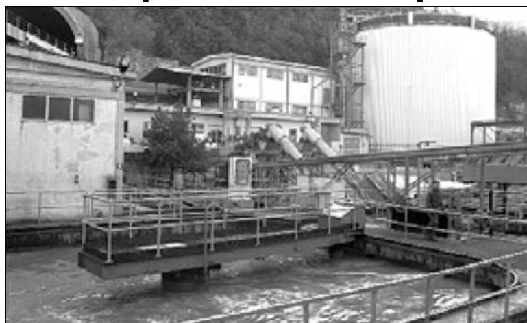
Čistilna naprava pri Škednju