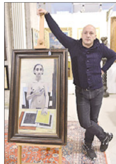
Nedir Princival ob sliki Feliceja Casoratija Dekle s knjigo (najvišje ocenjena slika na dražbi, 80.000 evrov)