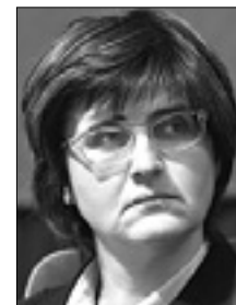
VERONIKA MARTELANC FOTODAMJ@N

ški komisiji, ki obravnava prošnje za azil. Najprej je izpostavila, da se nestrpnost širi predvsem zaradi splošnega nepoznavanja begunskega vprašanja. Zgovoren primer je recimo napis »refugees go home«, ki se je pojavil na neki steni, ni važno kje na svetu. »Ko bi le mogli, bi se begunci vrnili domov, a ne morejo,« je razložila. Na podlagi ženevske konvencije iz leta 1951 so begunci namreč osebe, ki se ne morejo vrniti v domovino, ker tvegajo smrt ali hudo preganjanje iz rasnih, etničnih, verskih, političnih ali socialnih razlogov. Imamo osebe, ki so deležne političnega azila, prosilce ter osebe, ki so deležne drugih oblik zaščite. Potem imamo razseljene, ki so morali zapustiti svoje domove in bežijo, a niso prestopili meja domovine. K nam prihajajo tudi migranti, ki so odpotovali iz drugih razlogov, teh je nekaj manj.