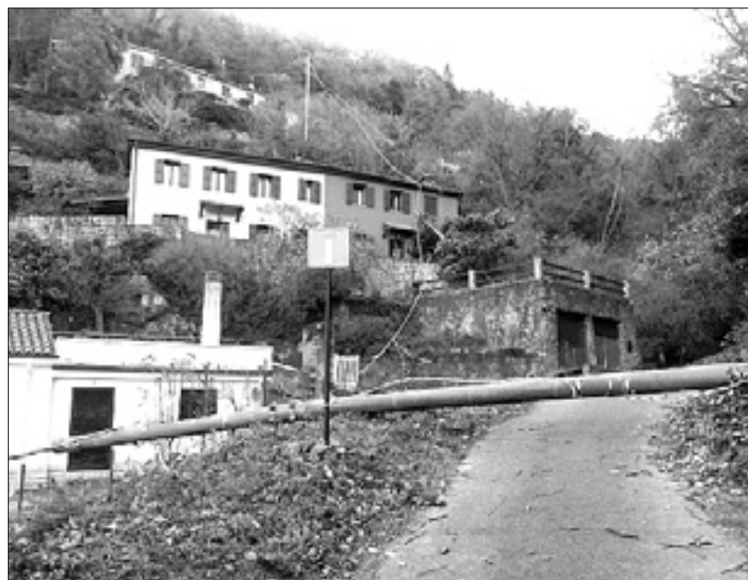
Drog električne napeljave je klonil sili vetra

Mnogo posegov je bilo predvsem na področju Opčin. Na Mandriji so morali gasilci odstraniti vejevje, ki je padlo na cesto, posegli pa so tudi zaradi visečih napušcev in nevarnih razmajanih strešnikov.