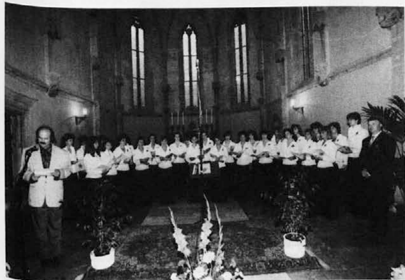
Prizor s slovesnega koncerta ob 20-letnici Dekliškega zbora »Devin«

Prelepa stara cerkev sv. Janeza Krstnika v Štivanu, vasi na meji med tržaško in goriško pokrajino, je v nedeljo, 31. maja, nudila nadvse primerno okolje za kvaliteten koncert, ki so ga pevke dekliškega zbora »Devin« pripravile za svojo 20. obletnico. Spored so sestavljale pesmi domačih in tujih avtorjev, od polifoničnih do pristno ljudskih in umetnih, pa tudi takih, ki so jih nekateri naši skladatelji napisali prav za ta zbor.