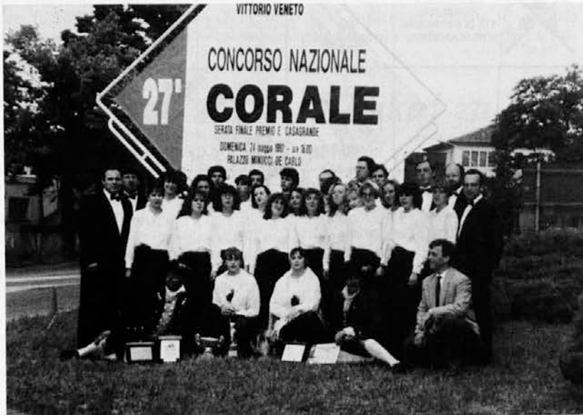
Zbor »Jacobus Gallus« na tekmovanju v Vittoriju Venetu

Prizadevanja slovenske vlade za manjšine pa so predvsem bila predmet razgovora med uglednim gostom in številnimi poslušalci. Govor je bil o odnosu med Trstom in Ljubljano, o vprašanju