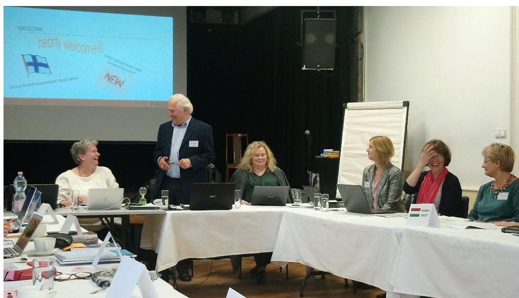
Stari upravni odbor