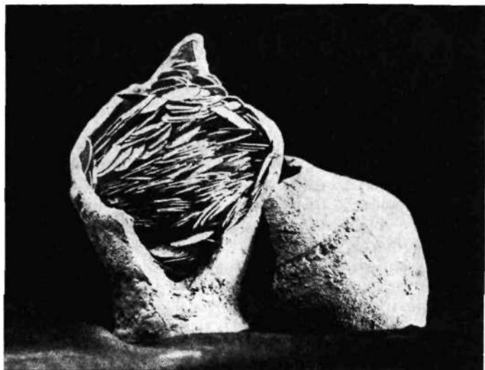
Glinasta posoda s srebrniki, najdenimi na Ruški cesti 1908