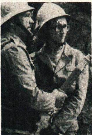
Tudi v Srednji vasi so gasilci pripravljani

Vžigalice in vžigalniki naj ne bodo na takem mestu, da jih otroci lahko dobijo v vsakem trenutku!