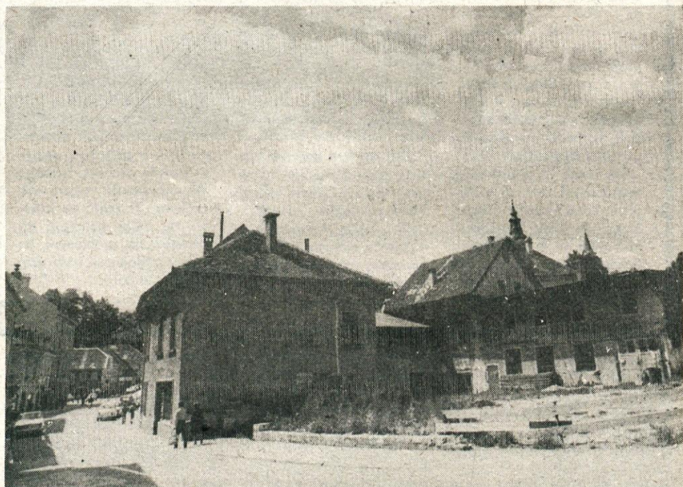
Tu naj bi bila zgradba družbene prehrane