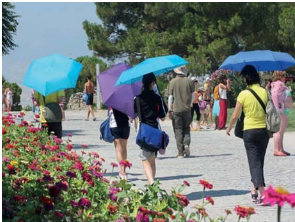
Slika 5. Ko senca telesa postane krajša od telesa, poiščem (ali naredim) senco: osebno senco za glavo lahko v nuji ustvarim tudi z dežnikom – senčnikom.

posredne osebne izpostavljenosti, ampak je slednja odvisna od vedenja in pigmentacije posameznika. V iskanju ravnovesja med zaščito pred škodljivimi učinki in potrebnim kratkotrajnim izpostavljanjem zaradi koristnih učinkov UV-sevanja, je bolj ali manj tvegano izpostavljanje posameznika odvisno od osebnih dejavnikov, zlasti fototipa kože (80).