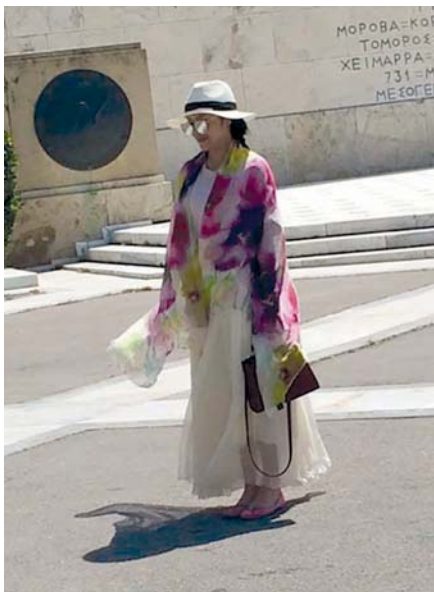
Slika 6. Pokriva oblačila, širokokrajno pokrivalo in sončna očala so zanesljiv in varen način zaščite večine telesa pred sončnim ultravijoličnim sevanjem. Na razkritih delih kože uporabim varovalne kemične pripravke.

V zaščiti pred soncem z oblačili je poleg izogibanja vlažnih oziroma mokrih in tesnih oblačil, potrebno paziti tudi, da preprečimo vrzeli z razkrito kožo v predelu gležnjev, zapestij in vratu med ovratnikom in zaščito s pokrivalom (91). Zaščitna oblačila naj bi pokrila vso kožo, kolikor je to mogoče (87), kakor prikazuje primer na Sliki 6.