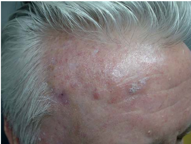
Slika 3. Aktinične keratoze so z ultravijoličnim sevanjem povzročene, pri svetlopoltih osebah pogoste prekanceroze ploščatoceličnega karcinoma.

Pomembni dejavniki tveganja za nemelanomske kožne rake so povezani z občutljivostjo kože posameznika za UV-sevanje, npr. fototip kože, prisotnost AK, predhodni nemelanomski kožni rak in imunska zatrtost (imunosupresija). Raste količina dokazov, da so določeni dejavniki tveganja za razvoj kožnega melanoma (npr. občasno izpostavljanje soncu, sončne opekline) pomembne tudi za razvoj BCK (1).