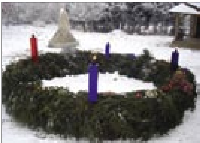
Velki adventni vejnec na dvauri iže, gde stoji »Mali Triglav«

venca pa so gledali, kak gorijo svejče. Pod starim orejom se je vino kūjalo venaj, pa ranč tak kak kauli venca, tū je lūstvo tō v