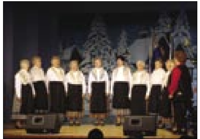
Monoštrske ljudske pevke

Ešče do daumi so varaške ženske poskrbele za veselo razpoloženje z vici pa popejvanjom porabskih pa svetih pesmi. Skrbela so tüdi za tau, ka Vero v dobro volau spravijo, ona pa jih je pogostila z domanjim pokerajom pa pijačo. Bile so počaščene, ka so leko bile z njauv na podelitvi.