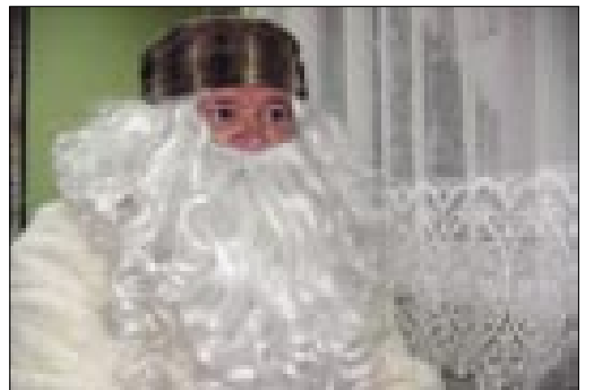
Najmlajše je obdaril dedek Mraz