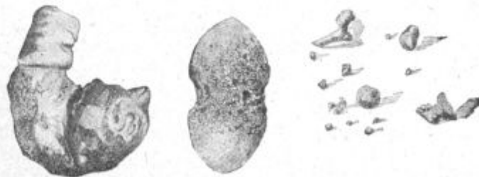
Slika 2. Scalnični kamni različnih velikosti in oblik.

Povod za nastanek scalničnih kamnov dajejo izmed krme često otrobi in na beljakovinah bogata krmlila, razen tega pa tudi krompir.