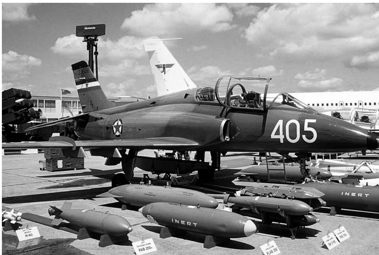
Soko G4 Supergaleb.

orožja pa je še najbolj mogoče primerjati s tržiščem opojnih drog)... Okoli tisoč jugoslovanskih podjetij se ukvarja tudi s proizvodnjo orožja. Od tega jih je izključno vojaških le kakih deset, v večini drugih podjetij pa je vojaški industriji namenjenih le 20 do 30% zmogljivosti. V vojaško industrijskem kompleksu je zaposlenih od 60 do 70.000 ljudi, od tega 200 visokokvalificiranih strokovnjakov. Jugoslovanska vojaška industrija proizvaja okoli 400 artiklov, 35 % razvite tehnologije pa se uporablja tudi v civilni industriji. Okoli 30% skupne proizvodnje vojaške industrije Jugoslavija izvažata in to pomeni v skupnem jugoslovanskem proračunu petino ali četrtno deleža; v primerjavi s turizmom torej prispeva celo dvakrat več! Rast fizičnega obsega proizvodnje in števila zaposlenih je v vojaški industriji skoraj dvakrat večja od tiste v civilni; izkoriščenost zmogljivosti v vojaški industriji je 95-odstotna (v civilni 77-odstotna). Stopnja rasti: do 7%, razmerje med izvozom in uvozom 5:1!!! 29