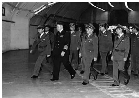
Admiral Branko Mamula v inšpekciji.

Admiral Mamula tudi poslov v Etiopiji ni postavljaj ob bok jugoslovanskim trgovskim operacijam na Švedskem zgolj zaradi retoričnega učinka. Sredi osemdesetih let je na Švedskem izbruhnila afera zaradi prodaje švedskega orožja Jugoslaviji, čeprav je bilo vsem vpletenim jasno, da je namenjeno nadaljnji preprodaji v države, s katerimi si Švedsi niso želeli mazati rok. Afera je izbruhnila, ko je postalo znano, da ima Irak na vojnih fregatah jugoslovanske izdelave švedsko oborožitev. Švedska družba Bofors je namreč dobila dovoljenja za izvoz topov v Jugoslavijo, kljub izbruhu afere pa dovoljenje ni bilo preklicano. Po švedski zakonodaji prodaja orožja v vojskujoče se dežele ni dovoljena, ravno tako pa ne v države, za katere obstaja sum, da ga bodo posredovale