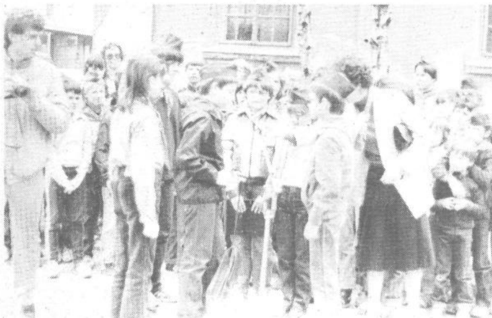
Viški pionirji predajajo torbico pionirjem iz Centra. V njej je dnevnik, v katerega pionirji vpisujejo čas in kraj predaje in v kratkem opisu vse pomembnejše akcije, ki so jih ob Kurirčkovi pošti opravili.