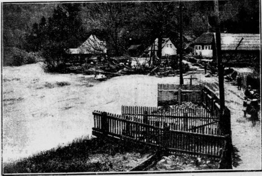
Povodenj v Zgornji Mežiški dolini. Narasla Meža pri Črni, kjer je odnesla več velikih žag, delavskih hiš in vrtov.

Po razmotrivanju splošnega položaja in razpravi o najmojeh ukrepih vlade, da poveča število let, potrebnih za pravico do pokojnine, je bilo sklenjeno, da se bo vršil dne 5. in 6. decembra v Zagrebu kongres delegatov organizacij državnih nameščencev iz vse Jugoslavije. Na kongres bodo pozvani tudi zastopniki onih organizacij, ki niso zastopane v glavnem savezu. Razpravljalo se je tudi o reorganizaciji Saveza in je bilo sklenjeno, da se izvede ista po vzgledu francoske organizacije, ki je sindikalistična. Načeloma je bil sprejet tudi sklep, da poda glavna savezna uprava na kongresu ostavko, da morejo vstopiti v upravo novi ljudje.