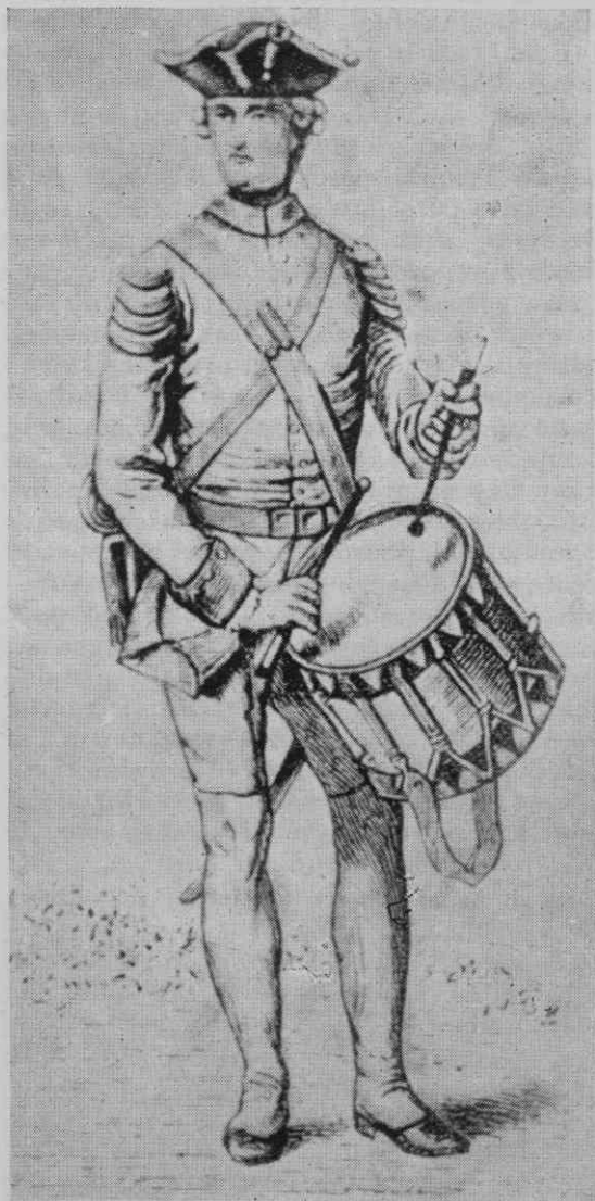
Vojaški bobnar iz dobe Marije Terezije

Vsi ti vojaki so bili po svojem poreklu pripadniki podložniškega stanu, ki je edini od vseh slojev prebivalstva moral služiti državi z orožjem v roki. Od vojaške službe so bili izvzeti le lastniki gruntov, njihovi edinci, zeti edink in tisti, ki so se odkupili od vojaščine pri svojem polku, medtem ko odkup pri nadrejeni zemljiški gosposki ni veljal. Popolnoma oproščeni vojaške službe so bili duhovniki, plemiči, dvorni svetniki, uradniki, višji uslužbenci, me-