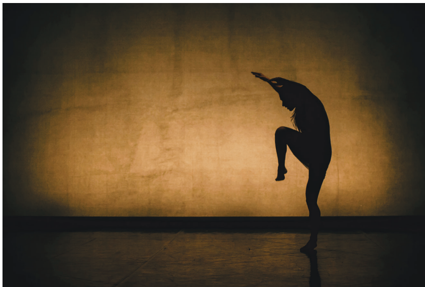
Slika 4 Song, Mala Kline (produkcija: ELIAS 2069, Mercedes Klein; koprodukcija: Zavod En knap, Pekinpah, Platform 0090, 2021).

samozaposlenih v kulturi s pravico do plačila prispevkov, povišanje javnih sredstev za sodobni ples in zagotavljanje honorarjev, ki bodo skladno z določili Zakona o uresničevanju javnega interesa za kulturo primerljivi s plačami javnih uslužbencev v kulturnem sektorju. Veliko ustvarjalcev se zaradi narave dela sooča s fizičnimi omejitvami in trajnimi posledicami številnih poškodb, iz česar izhaja potreba po uvedbi sistema prekvalifikacij, celostni ureditvi obdobja pred upokojevanjem na podlagi specifik poklica sodobnega plesalca in razvoju zmogljivosti za nove zaposlitvene možnosti znotraj področja dela.