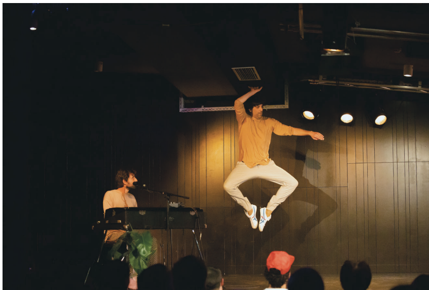
Slika 5 Večer plesnih solov, Dejan Srhoj (produkcija: Dejan Srhoj in Nomad Dance Academy Slovenija, 2023).