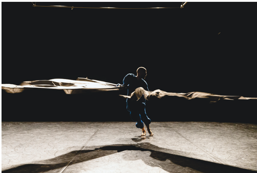
Slika 1 BO/Biološki odpadki, Jurij Konjar (produkcija: DUM društvo umetnikov; koprodukcija: Društvo za umetnost giba ZaTo, Zavod En-Knap, 2021).