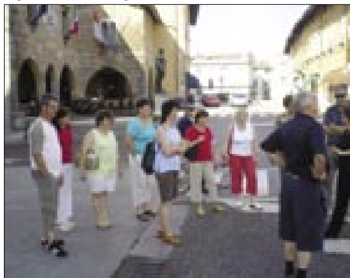
Udeleženci seminarja se spoznavaajo s Čedadom

mišljen kot splet teoretičnih in praktičnih izobraževalnih ur, udeleženci so poslušali predavanja, sodelovali v pedagoških delavnicah, opazo-