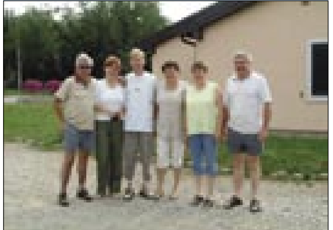
Člami Gledališke družine Nindrik-indrik