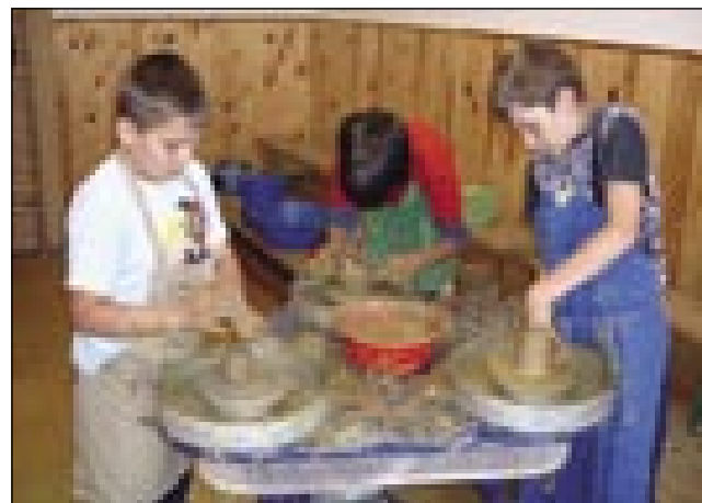
... drugi na vreteni

pa šli na skupni izlet v Sombotel, gde smo si poglednili cerkev sv. Martina pa malo mesto. Gnes pa že aktivno delo poteka pri nas pa na