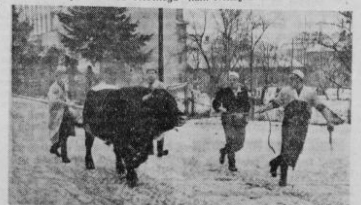
S spretnostjo ukrotijo tudi najbolj podivjanega bika

Pri »Mesninah« Ptuj je sedaj vsega 22 ljudi, od tega 16 mesarjev in 4 vajenci. Njihovo odkupno in preskrbovalno območje se ne sklada z občinskim območjem, saj nakupujejo živino na območju nekdanjega ptujskega okraja direktno na sejmih in preko zadrug. Večina Ptujčanov kupuje meso in mesne izdelke v njihovih prodajalnah. Nekaj mesa in mesnih izdel-