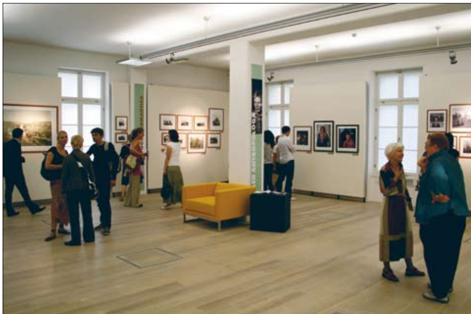
Pogled na razstavo Trije pogledi na sever

Samijev, etnologi pa dokaze o eksotični prvobitnosti; romantiki so hoteli ohraniti nomadska plemena, ki jih civilizacija ni pokvarila, medtem ko so pohodnike privlačile neskončne neobljudene pokrajine.