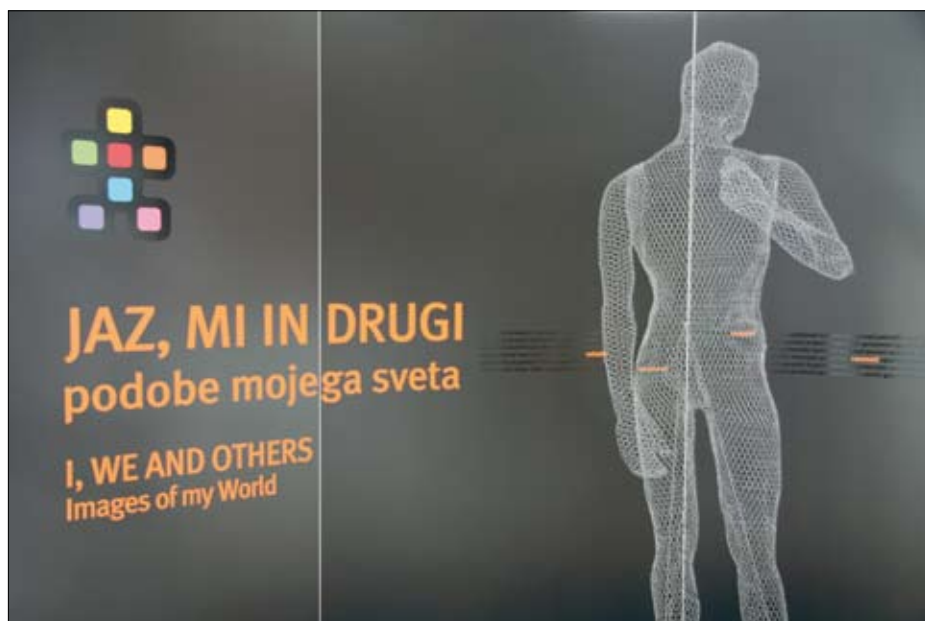
Uvodni pano na razstavi Jaz, mi in drugi (Dokumentacija SEM)

Z odprtjem druge stalne razstave Jaz, mi in drugi: podobe mojega sveta v drugem nadstropju razstavne hiše SEM je muzej končal svojo petnajstletno vsebinsko prenovu. Konceptualni okvir večdelne stalne razstave kot opredmetenega temelja poslanstva