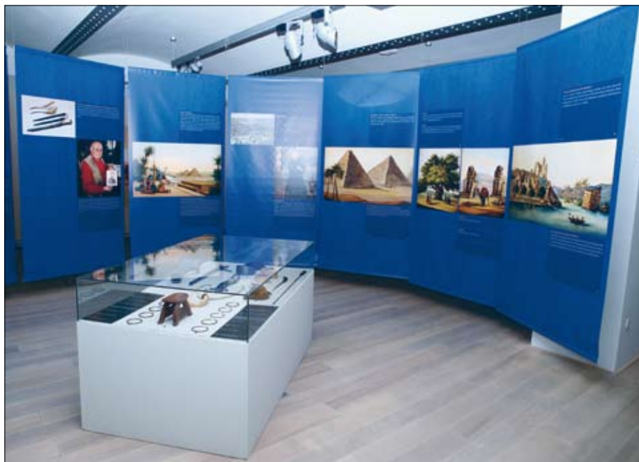
Razstava o Ignaciju Knobleharju Sudanska misija 1848–1858