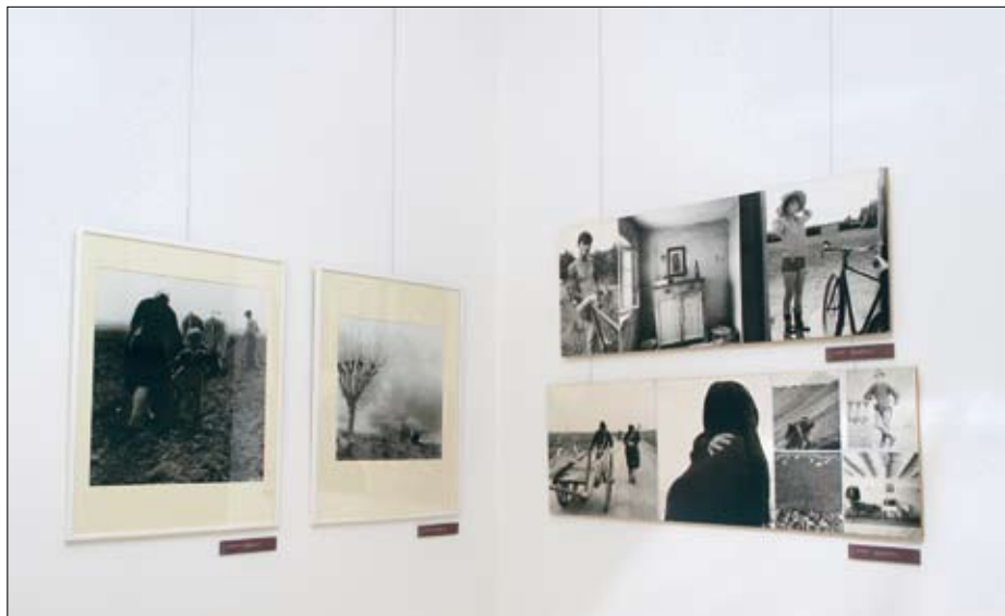
Fotografije na razstavi Pogledi/Sguardi