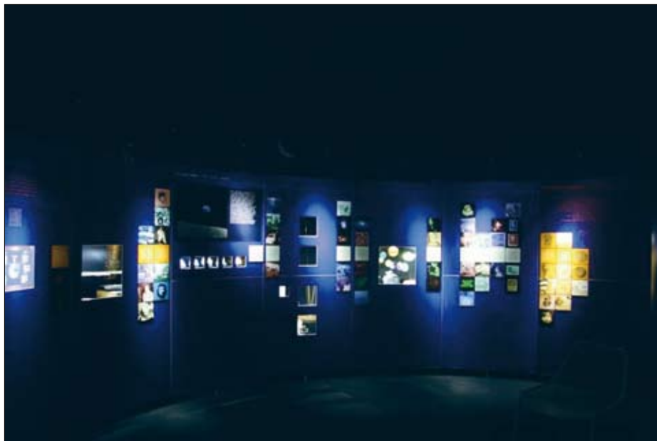
Razstavni sklop Moj osebni svet v okviru razstave Jaz, mi in drugi