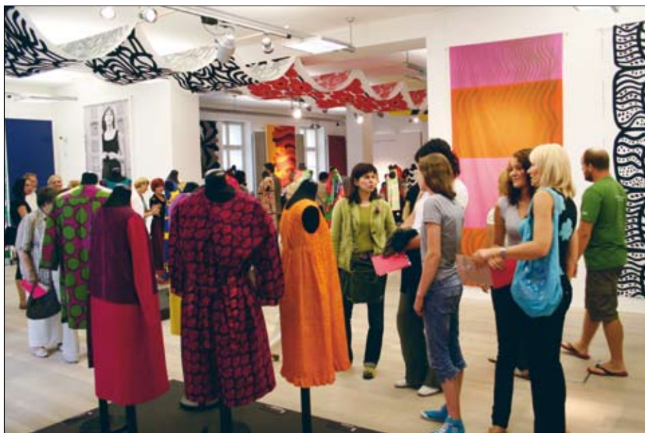
Odprtje razstave Marimekko

Marimekko je bil ustanovljen leta 1951 v Helsinkih na Finskem po zamisli karizmatične in vizionarske Armi Ratia. Ime podjetja – v dobesednem prevodu “Marijina obleka” – ima različne interpretacije; odraža mnogoterost asociacij in dvojnosti, ki označujejo estetiko Marimekka: nacionalno in mednarodno, tradicionalno in moderno, ruralno in urbano, naravno in tehnološko. Uvedba Marimekka v petdesetih letih je pomenila oblikovalsko senzacijo, ki se je razširila po svetu. Je eno prvih tekstilnih in modnih podjetij v povojnem obdobju in kasneje. Izrazito veliki tekstilni vzorci in nekonvencionalno krojena konfekcija so prinesli barvitost in neformalnost v siceršnje oblikovanje in svet mode. Marimekko je neločljivo povezan s Finsko, kar je podrobno načrtovala Armi Ratia. Izdelki so bili poimenovani s finskimi imeni,