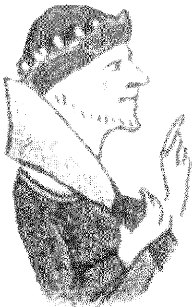
Mesar po Tržaškem statutu iz leta 1350. A butcher as per Trieste statute from 1350.

Pravico do peke kruha za prodajo v Piranu je imelo mesto in jo je oddajalo letno v zakup na dražbi. V osemdesetih letih 13. stoletja je letna zakupnina pravice za peko znašala 100 liber. (Mihelič, 1986, 1, 2, 3, 4). Zakupnik je to pravico proti plačilu posredoval izbranim pekom. Plačilo je bilo včasih določeno relativno: pek je dolgoval zakupniku 4 solide za vsak star žita, ki ga je porabil pri delu. Če ni imel lastne peči, je pek vzel v zakup tujo peč. (PA, NK 6, f. 27 verso, 1290, 8. julij; ibid., f. 29, 1290, 19. julij).