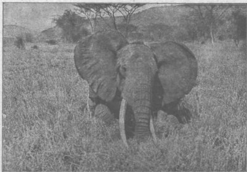
Afrikanski slon, šteri je ranjeni obležo v džungli.