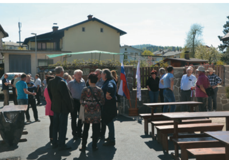
Živahni pomenki pred odprtjem asfaltirane ceste ob zbornici

Hvala vsem za udeležbo in sodelovanje ter vsem, ki ste v tem dolgem obdobju kakorkoli karkoli pripomogli, da je cesta urejena.