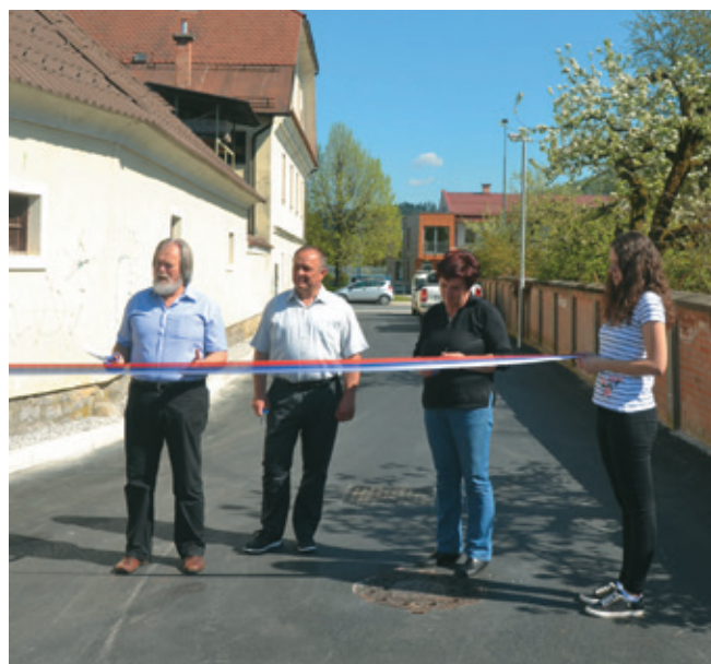
Pogled še z druge strani, proti Tržaški

Župan je izpostavil, da se spominja, da se je o ureditvi ceste govorilo že ob njegovem prihodu na Vrhniko, pa potem, ko je bil direktor KP Vrhnika in končno v manda-