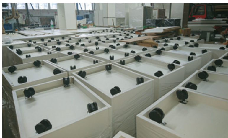
Mnogo kolesc za premičnost pohištva