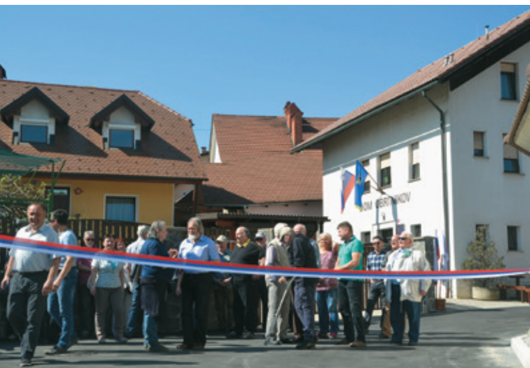
Trak je že napet, se nekaj priprav, in zgodilo se bo.