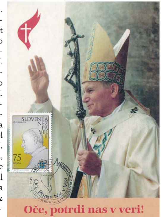
Papež Janez Pavel II. s palico in z razpelom kot motiv na MC, ki jo je izdala Pošta Slovenije leta 1996 ob njegovem prvem obisku v Ljubljani v Stožicah.

Papež Janez Pavel II. je opravil več kot sto potovanj po celem svetu, med drugimi je bil tudi dvakrat v Sloveniji. Prvič je leta 1996 prišel na Brezje, v Ljubljano in Postojno, drugič pa leta 1999 v Maribor, ob razglasitvi škofa Antona Martina Slomška za blaženega. Poljski papež s slovansko dušo je svoj pravi obraz pokazal tudi januarja leta 1992, ko je Sveti sedež priznal samostojnost in neodvisnost Slo-