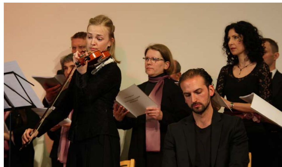
Koncert zboru Consortium musicum na Romualdovem dnevju, v soboto 23. aprila 2016, v okviru Dnevov Škofjeloškega pasijona 2016. Izvedli so delo Andreja Missona - Slovenski vojni requiem.