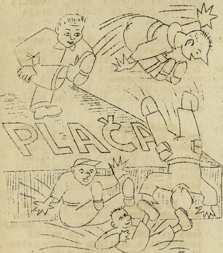
S PLAČE BOMO LETELI.

BEL ROŽNI VENEC se je našel v zelenem suknjiču, ki je bil odan nazaj v skladišče. Dobi se v naši upravi.