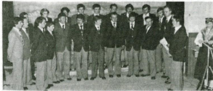
Pevski zbor Hotedršica