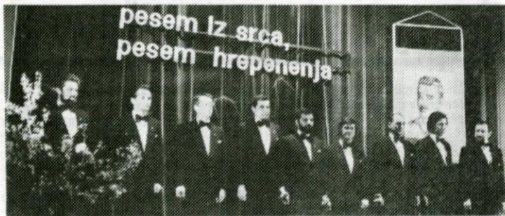
Logaški oktet na koncertu v Logatcu 17. marca letos