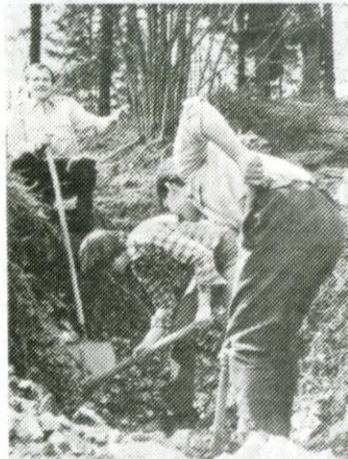
Mladina je na težkem terenu opravila pomembno delo

Tudi mladi v občini Logatec se že pripravljamo na letošnje mladinske delovne akcije. V soboto, 31. marca 1979, smo organizirali letošnjo prvo veliko delovno akcijo, na kateri je sodelovalo okoli 150 mladincev in krajanov. Z akcijo smo