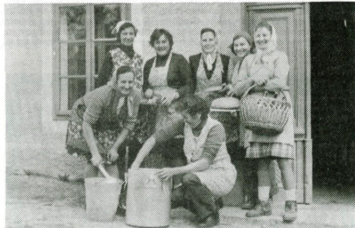
Tudi skrbno in iz srca pripravljen obrok je prispeval k uspešni akciji

MILE: OO ZSMS Tabor: MDA sem si drugače predstavljal, danes pa sem spoznal, da je to nekaj čudovitega. Zelo lep je občutek, da si tudi