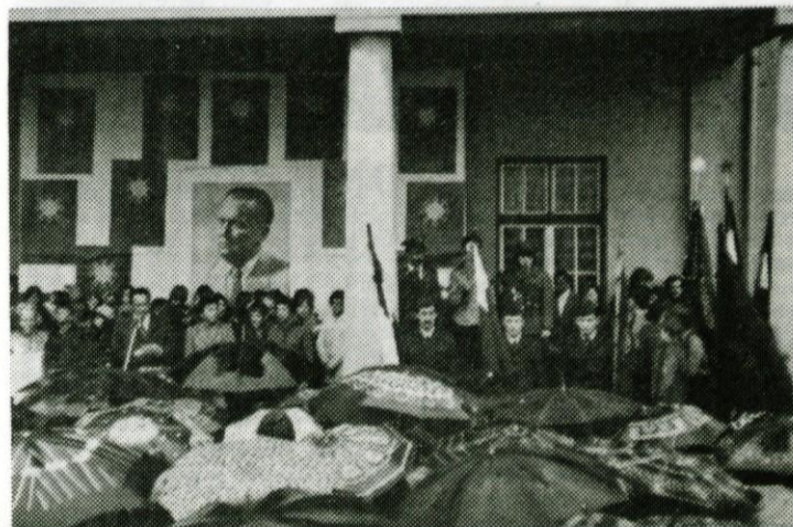
. . . in ob prihodu v Logatec