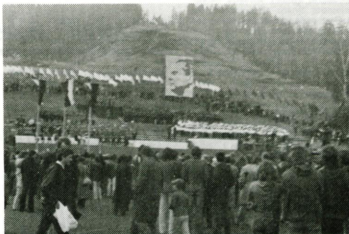
Slovesnost pred odhodom zvezne štafete mladosti iz Raven na Koroškem . . .