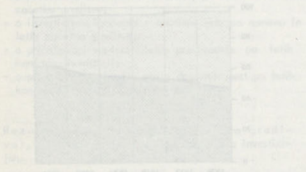
41. Tabela: Delež lastnih in združenih sredstev v obliki lastnih in združenih sredstev v letih 1976-1981. (v %)

Delež lastnih in združenih sredstev v obliki lastnih in združenih sredstev v letih 1976-1981. (v %)