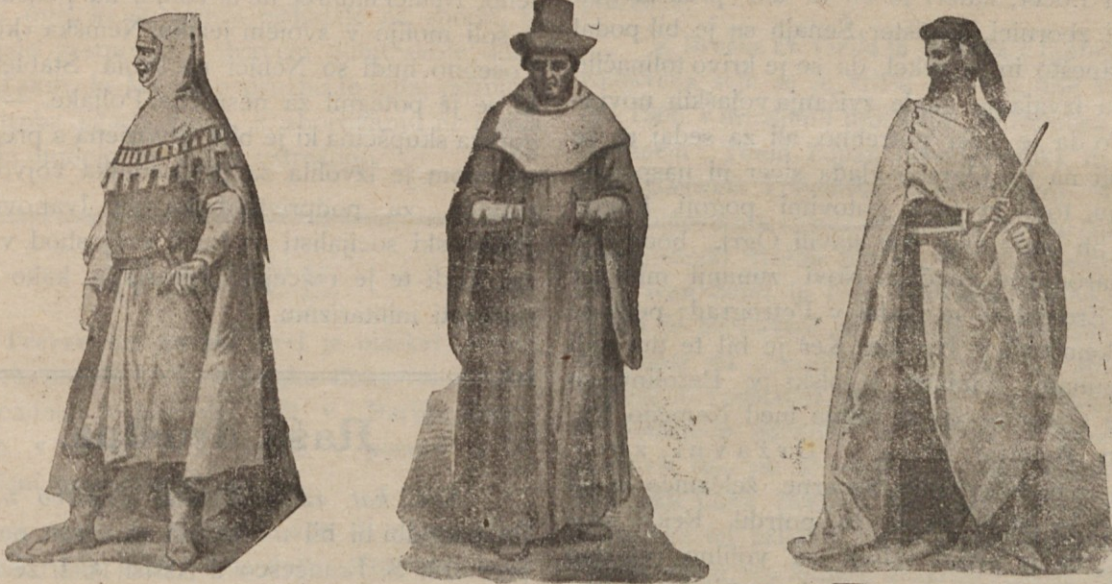
Tržaška noša pred 700 leti.

srce še odprto posvetni, zapeljivi ljubezni, ko je nje srce plamtelo v ljubezni do nebeške Kraljice, katera si je izbrala na tem prelepem Otoku svoje bivališče. Spomnila se je, kako srečna je bila, ko je kakor planinska vila prepevala Mariji pesmice, spomnila se je, kako je nekoč v priprostem zupanju potegovala za vrh v cerkvi, da ji glas zvona izpolni željo pri nebeški Materi. Spoznala je, da on ni bil vreden nje ljubezni, da le Marija zna ljubiti ljubeče srce — in vrnila se je k nji. Sveta ljubezen je zažarela še z večjim plamenom, ko nekaj, ko je sedaj prejela Onega, ki pravi: «Pridite k meni vsi, ki ste obteženi» In lažje ji je bilo, oh kako lahko, kako sladko, kako prijetno. Bila je zopet srečna, srečnejša ko nekaj — — — — — Le nekaj je želela, da bi nje mlajše lahkomišeljne tovarišice ne doživele take prevare, kakor jo je bila sama. To željo je imela, ko je potegnila za skrivnostni zvon — — — — —.