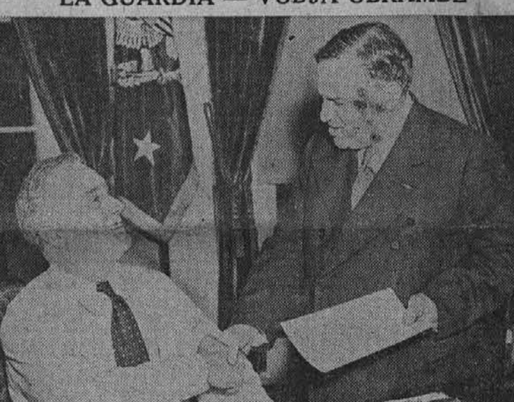
Predsednik Roosevelt je imenoval te dni newyorškega župana LaGuardijo za voditelja civilne obrambe Zedinjenih držav. Na gornji sliki je videti, ko mu izroča imenovanje.