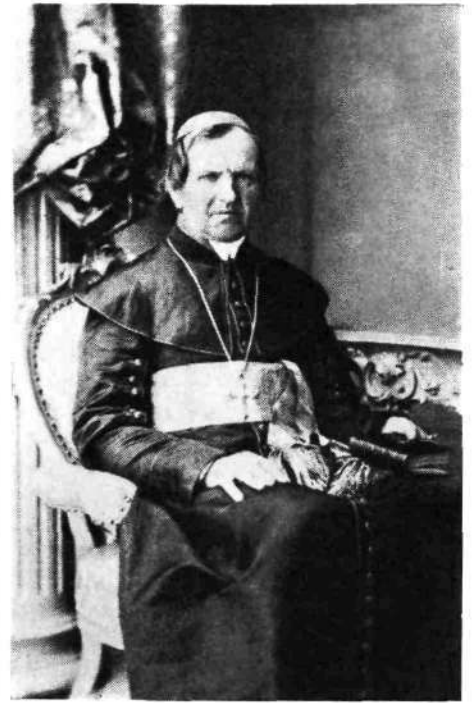
Slika št. 10