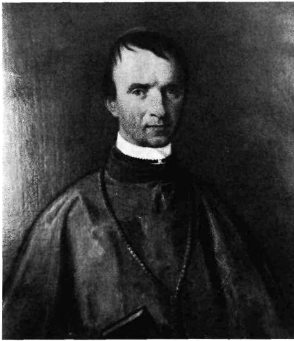
Slika št. 1