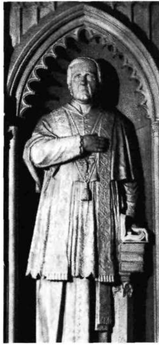
Slika št. 11