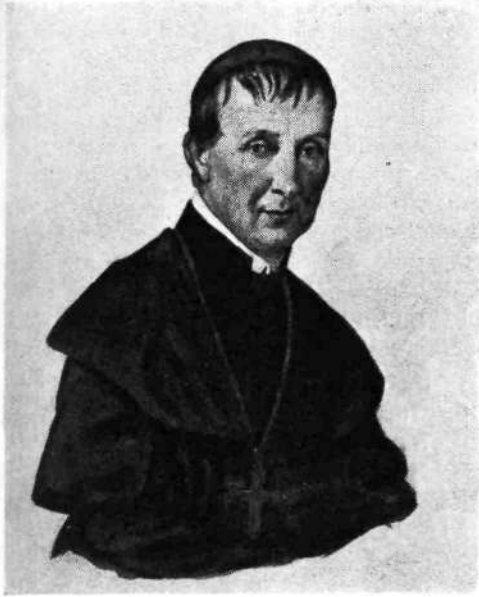
Slika št. 4