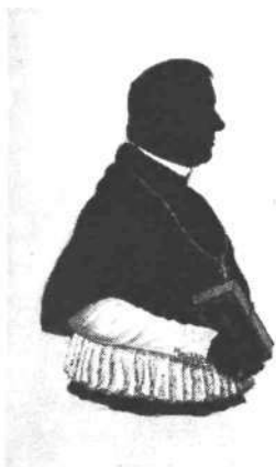
Slika št. 2