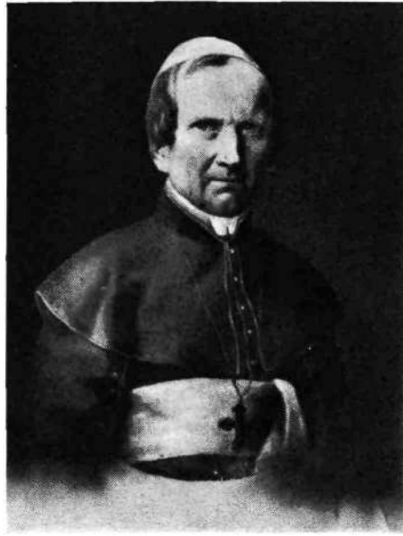
Slika št. 5