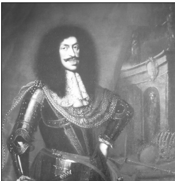
Benjamin v. Block: Portret cesarja Leopolda I. ( Gorizia barocca , str. 118).

V zvezi z D'Ischinim odnosom do habsburške sile lahko omenimo še slovesen dogodek, ki je leta 1660 zaznamoval goriško zgodovino. Cesar Leopold I. je obiskal Gorico in sprejel poklon goriških deželnih stanov. Ta obisk je predstavljal prvi osebni poklon goriških stanov vladarju, ki je nosil naslov cesarja. 51 V Gorico pa so prihitali in se mu poklonili tudi številni plemiči iz beneške Furlanije. To dejstvo je odsevalo tradicionalno naklonjenost furlanskega plemstva do Habsburžanov in je vznemirilo beneške oblasti. 52 Tudi D'Ischia je šel v Gorico in se poklonil cesarju. Ob tej priliki je spisal panegirično delo v čast Leopoldu I. z naslovom Le gare d'affetto e gli affettuosi gareggiamenti Praticati tra le due non meno Reali, che Serenissime case d'Avstria, e di Goritia. Panegirica Narratione (Udine 1660). Delo je govorilo o odnosih med Habsburžani in goriškimi grofi. D'Ischia omenja, da je delo izročil cesarju, a drugi sodobni viri tega ne potrjujejo. 53