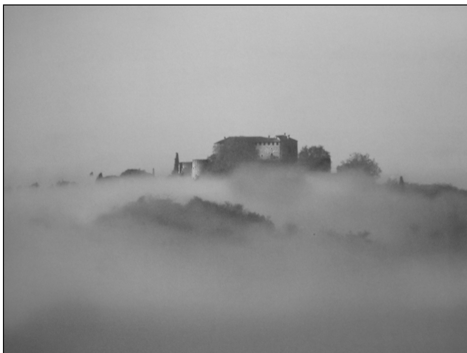
Pogled na goriški grad (Pillon, Gorizia Millenaria, str. 135).