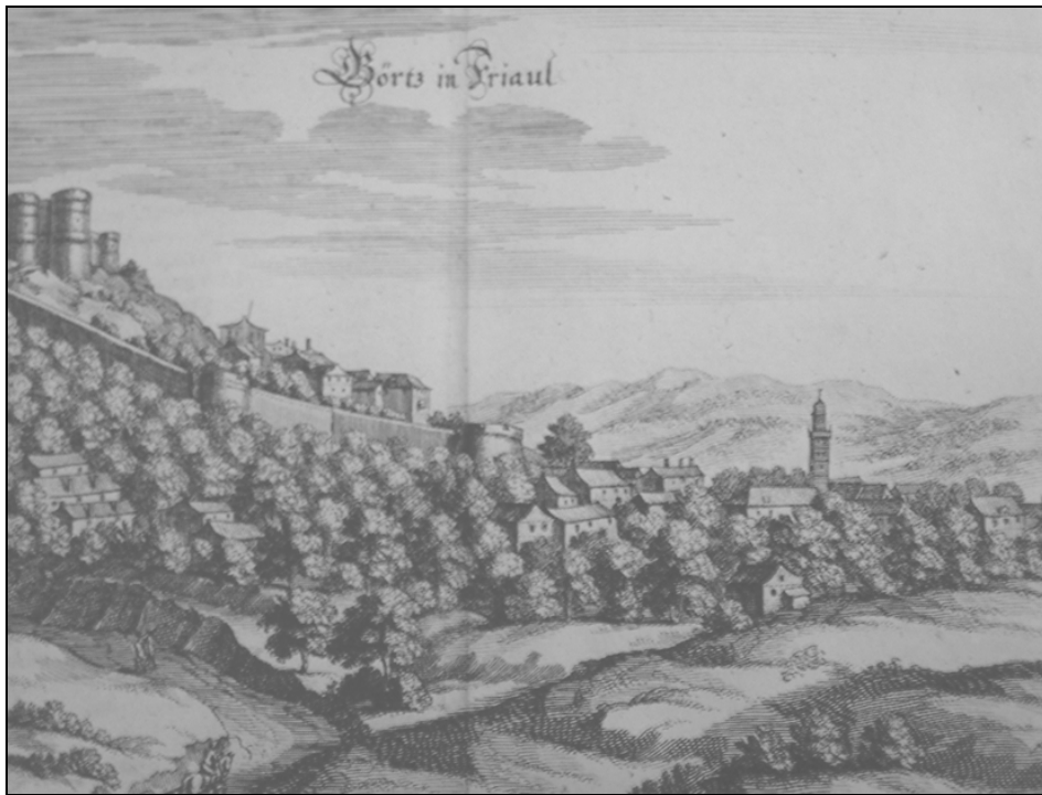
Gorica sredi 17. stoletja (Marco d'Aviano, str. 124).