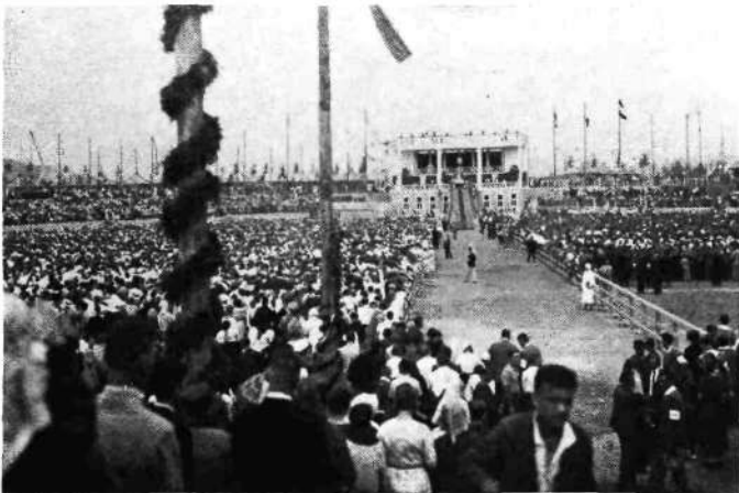
Evharistični kongres v Ljubljani. Sv. maša na stadionu

29. Na praznik sv. Petra in Pavla so gimnazijski abiturienti v slovesnem sprevodu prenesli podobo Matere Božje iz stolnice na stadion, kjer je potem 87 duhovnikov obhajalo okoli 20.000 šolske mladine. Najslovesnejša in najlepša prireditev ne samo tega, ampak vseh kongresnih dni je bila nočna procesija mož in fantov, po številu okoli 30.000, od katerih so skoraj vsi nosili prižgane plamenice. V procesiji, ki se je vila med gostimi špalirji vernikov po glavnih mestnih ulicah proti stadionu, je sodelovalo kakih 25 godb. Na stadionu je bila polnočnica s skupnim obhajilom, pa tudi po ljubljanskih cerkvah so se brale slovesne polnočnice. Ta večer je opera vprizorila Wagnerjevega »Parsifala«, v frančiškanski cerkvi je bil koncert Čiril - Metodovega zbora iz Zagreba, ki je izvajal česnokovo »Liturgijo sv. Ivana Zlatousta«, Pevska zveza je izvajala mogočen koncert evharistič-