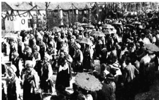
Evharistični kongres v Ljubljani. Narodne noše v glavni procesiji