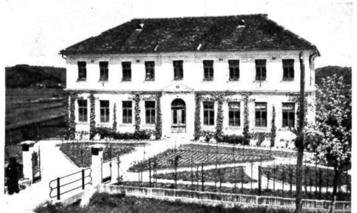
Šolsko poslopje na Barju, sezidano po potresu l. 1895.

7. Ljubljansko Barje slavi kar 4 važne jubileje: 100-letnico naselbine, 60-letnico prve zasilne šole, 50-letnico redne šole in 40-letnico nove šole. Letos se je barjanska šola razširila na 6 razredov: 4 osnovne in