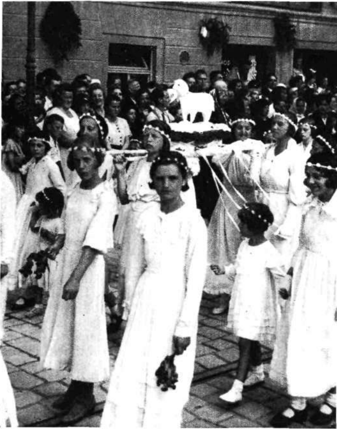
Evharistični kongres v Ljubljani. Deklice v glavni procesiji