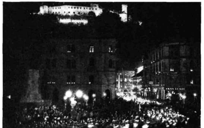
Evharistični kongres v Ljubljani. Nočna procesija mož na stadionu