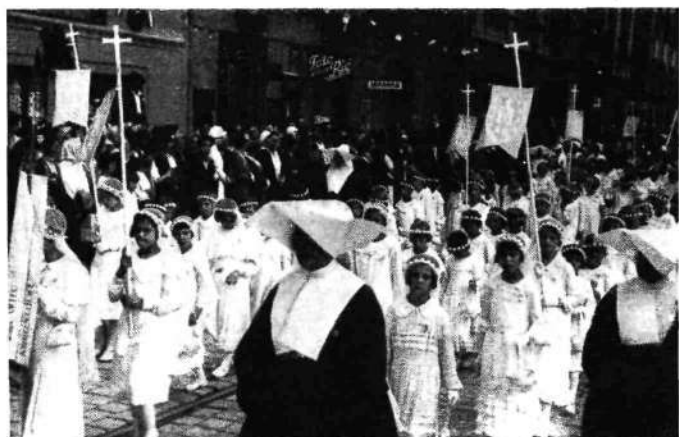
Evharistični kongres v Ljubljani. Deca v glavni procesiji

28. Danes se je pričel II. evharistični kongres za Jugoslavijo, ki bo trajal tri dni. Za kongres se je Ljubljana kar najlepše pripravila, vse ulice so slavnostno okrašene z zastavami, zelenjem in žarnicami za svečano nočno razsvetljavo mesta. Ulice so živahno razgibane, s postaje se vsipajo v mesto vedno nove množice vernikov. Tudi odličnih gostov je že mnogo, nekateri pa še pridejo danes in jutri.