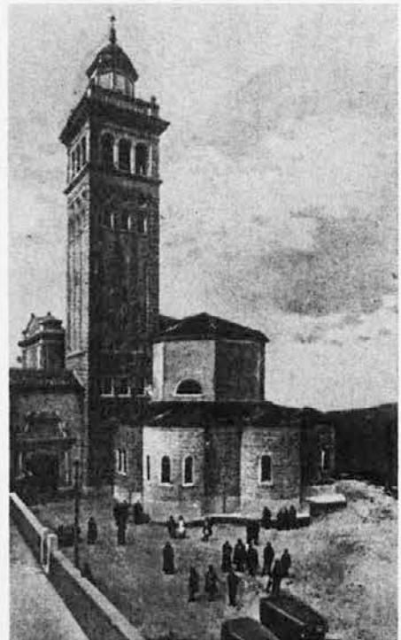
Mogočni zvonik svetogorskega svetišča, visok 45 m; štirje zvonovi, ki so v njem, tehtajo skupno 11.113 kg

Knjižica se dobi na Sv. gori. Romarji naj bi si jo oskrbeli in doma opravljali devetdnevno v tem Marijinem letu.