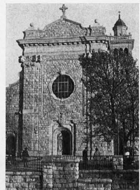
Pročelje božjepotne cerkve na Sveti gori (682 m)

Se veliko, veliko več moči in upanja nam zbuja božja Mati Marija, ki nam je prav po domače, v našem slovenskem jeziku naročila: »Prosimo milosti!« Svetogorska božja pot po Marijini besedi približa dejstvo, da je rešitev vsakemu človeku zagotovljena, da bo popoln življenjski