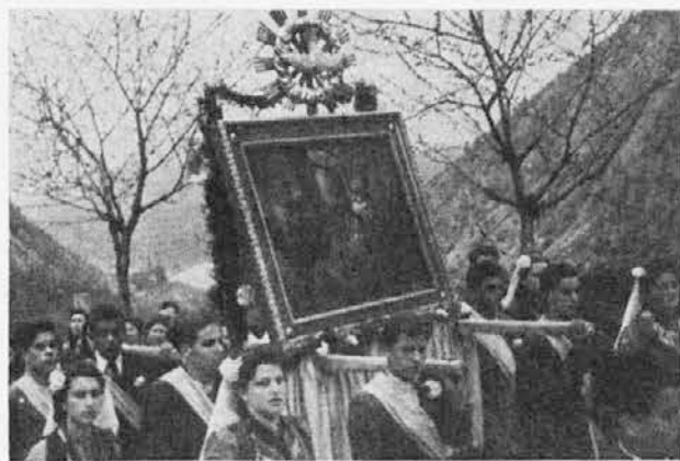
Milostna podoba svetogorske Matere božje se dne 8.4.1951 vrača na Skalnico

O Mariji iz Nazareta poroča evangelij, da je po rojstvu Jezusovem morala v begunstvo v Egipt. Svetogorska Mati božja pa je morala trikrat v begunstvo.