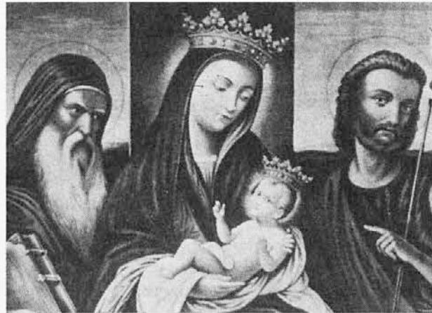
Podoba svetogorske Matere božje

Na cesti iz Mirna v Vrtojbo sem ustavljal avtomobile, da bi me kdo peljal. Sprejel me je neki voznik kombija. Ko sem mu povedal, da grem na Sveto goro, je rekel, da že več let ni romal tja gor. Iz njegovih besed in naglasa sem sklepal, da mu je žal, ker je romanje opustil. Takih ljudi je veliko. Opustili so romanje, a srce jih še vedno vleče na ta sveti kraj. Prihajali bi, ko ne bi bilo, toliko težav. Ko bi šli vsi, bi šli tudi oni. Drugi bi jih potegnili s seboj, kot narasla reka odnese vse, kar doseže.