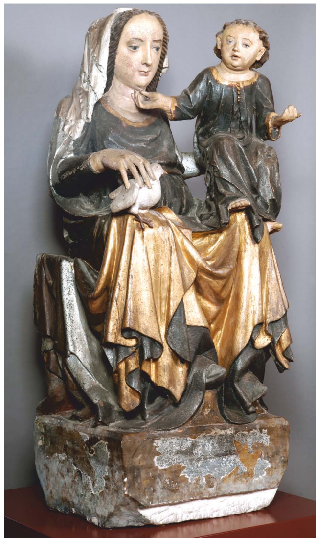
Gotski kip Marije z detetom na prestolu, datiran med letoma 1360 in 1370. Od leta 1862 pa do leta 1941 je stal v kapelici sv. Ane v Ormožu.

Kje so hranili nagrobno ploščo družine Pethe de Hetes iz kapele sv. Ane v kriпти nekdanje frančiškanske cerkve, ni znano. Ko so sredi stoletja po ukinitvi fevdalnega reda opustili mitninsko postajo v zahodnem predmestju Ormoža, pa so sezidali novo kapelo sv. Ane, kamor so prenesli tudi marmorno kamnito napisno ploščo. Ugibamo lahko, da je bila v novi kapelici prvotno ali slika ali pa kip sv. Ane. Toda od leta 1862 dalje je tu stal