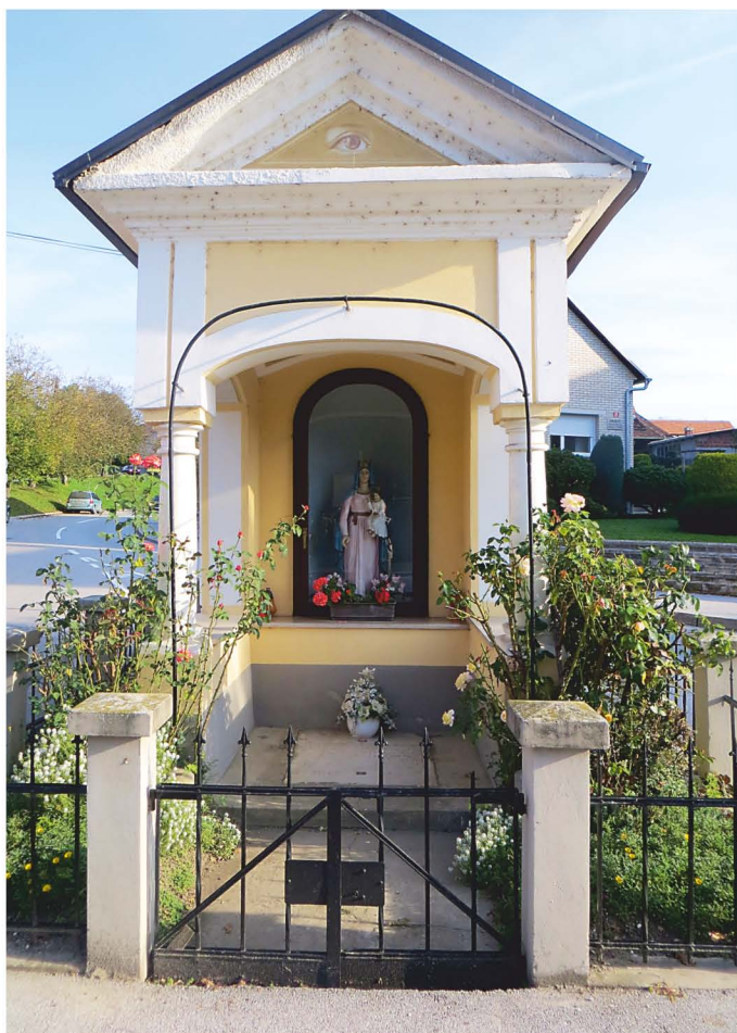
Kapelica sv. Ane v Ormožu, danes s kipom stoječe Marije z detetom.

Ključne besede: kapelica sv. Ane, Ormož, spomenik lokalnega pomena, Ptujška cesta