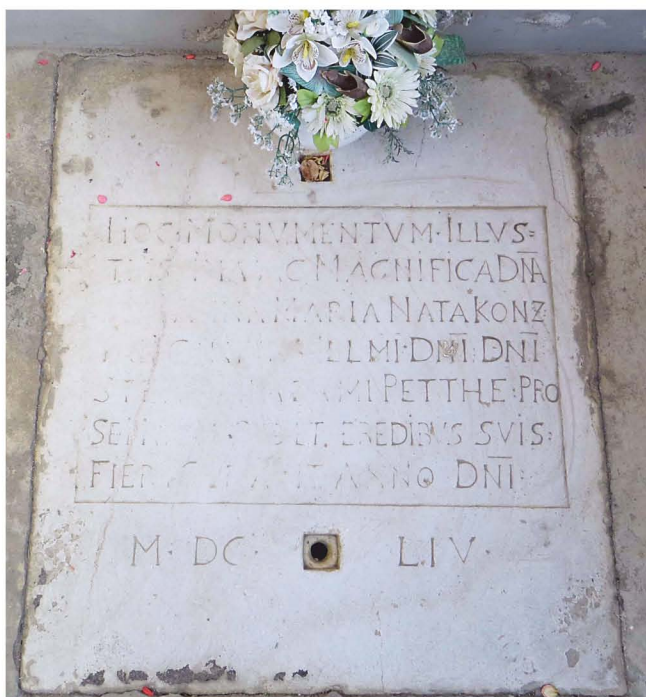
Vodoravno položena nadgrobna plošča rodbine Pethe de Hetes v preddverju kapelice sv. Ane.

Povsem neverjetno se zdi, da bi v 1. polovici 17. stoletja plemiški par pokopali na omenjeni lokaciji, ki je bila takrat izven mestnega obzidja. Gre namreč za plemiško rodbino baronov Pethe de Hetes, ki je bila lastnica ormoškega gospostva kar pet generacij (1604–1740). Kot najverjetnejša se kaže možnost pokopa v nekdanjem observantskem/frančiškanskem samostanu, ta je namreč že prej služil ormoškim fevdalcem za zadnje počivališče.