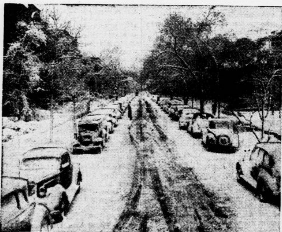
Severne predele Zedinjenih držav je obiskal v zadnjih dneh zimski mráz. Toliko snega kakor te dni niso imeli v Chicagu niti med pravo zimo. Slika nam prikazuje nezadržano »belo opojnost« baš na eni čičaških cest