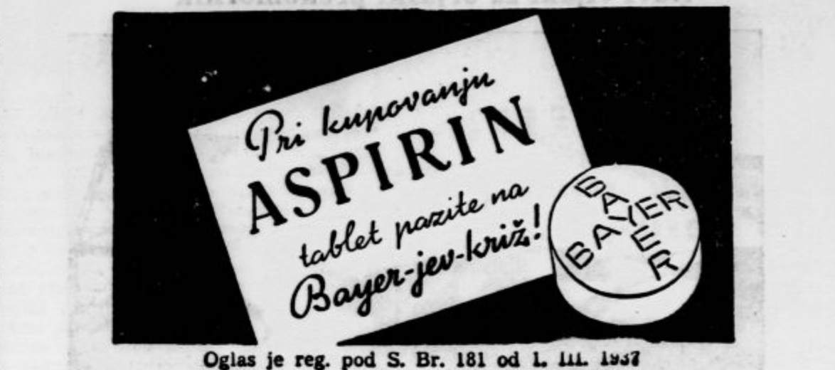
Oglas je reg. pod S. Br. 181 od L. III. 1937

Edina uradnica je z delom preobremenjena. Poštne enote, ki iz meseca v mesec prekoračujejo obseg odrejen za uslužbenca lahko označimo že tu kot težke, z ozirom na jaki denarni promet in številne poštne okoliše: (Klek, Planinska vas, Svine, Marija reka, Sv. Katarina, Sv. Planina, Sv. Marko, Ceče) kamor je dostavljanje naporno in zamudljivo. Aktivnost pošte in večajoči se posli terjajo na tem uradu čimprejšnjega povečanja osebja in novih bolj odgovarjajočih prostorov. Poštni urad Trbovlje I. pa se mora zaradi svojega obsežnega trgovsko industrijskega okoliša boriti še s podvojenimi težkočami. Promet je tu vsled izboljšanih gospodarskih priht v stalnem porastu in izkazuje v preteklem letu 38.000 vplačanih čekovnih položnic v skupnem znesku od 38.085.404 din, a izplačanih 14.423 položnic za okroglo 7 milijonov dinarjev, denarnih nakaznic preko 7000 za 2 milijona dinarjev, izplačanih pa 3140 nakaznic za 895.000 din. Celotni denarni promet presega 85 milijonov din. Razumljivo je da je za tak ogromni denarni obtok za telegrafsko-telefonsko službo, ki je zaradi številnih poslovnih zvez obsežnega in