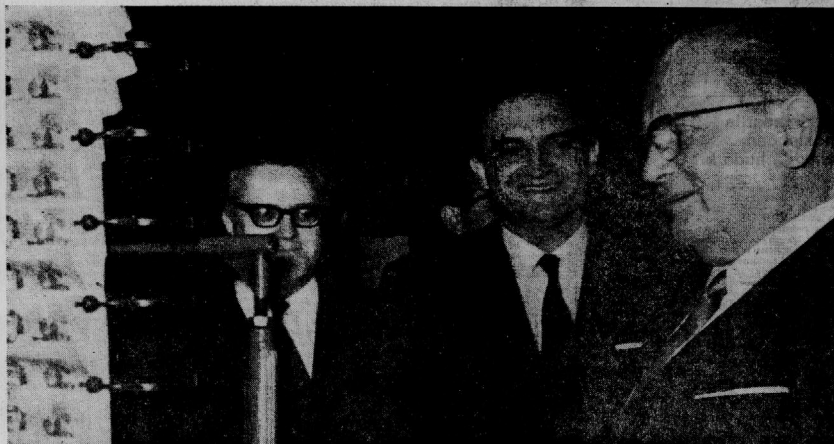
TITO NA OBISKU PRI »POLITIKI« — Predsednik republike si je v četrtek zvečer ogledal novo poslopje beograjskega lista »Politika« in se dalj časa pogovarjal z novinarji. (Poročilo objavljamo na 2. strani.)

GLASILO SOCIALISTIČNE ZVEZE DELOVNEGA LJUDSTVA SLOVENIJE