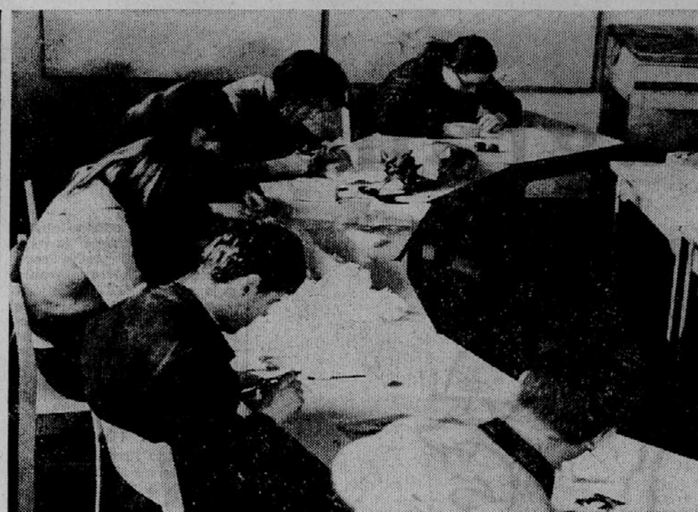
VEDRO IN VARNO DOMOVANJE - pomeni 17 duševno prizadetih mladostnikov...