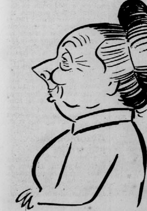
za življenjsko delo v gledališki umetnosti