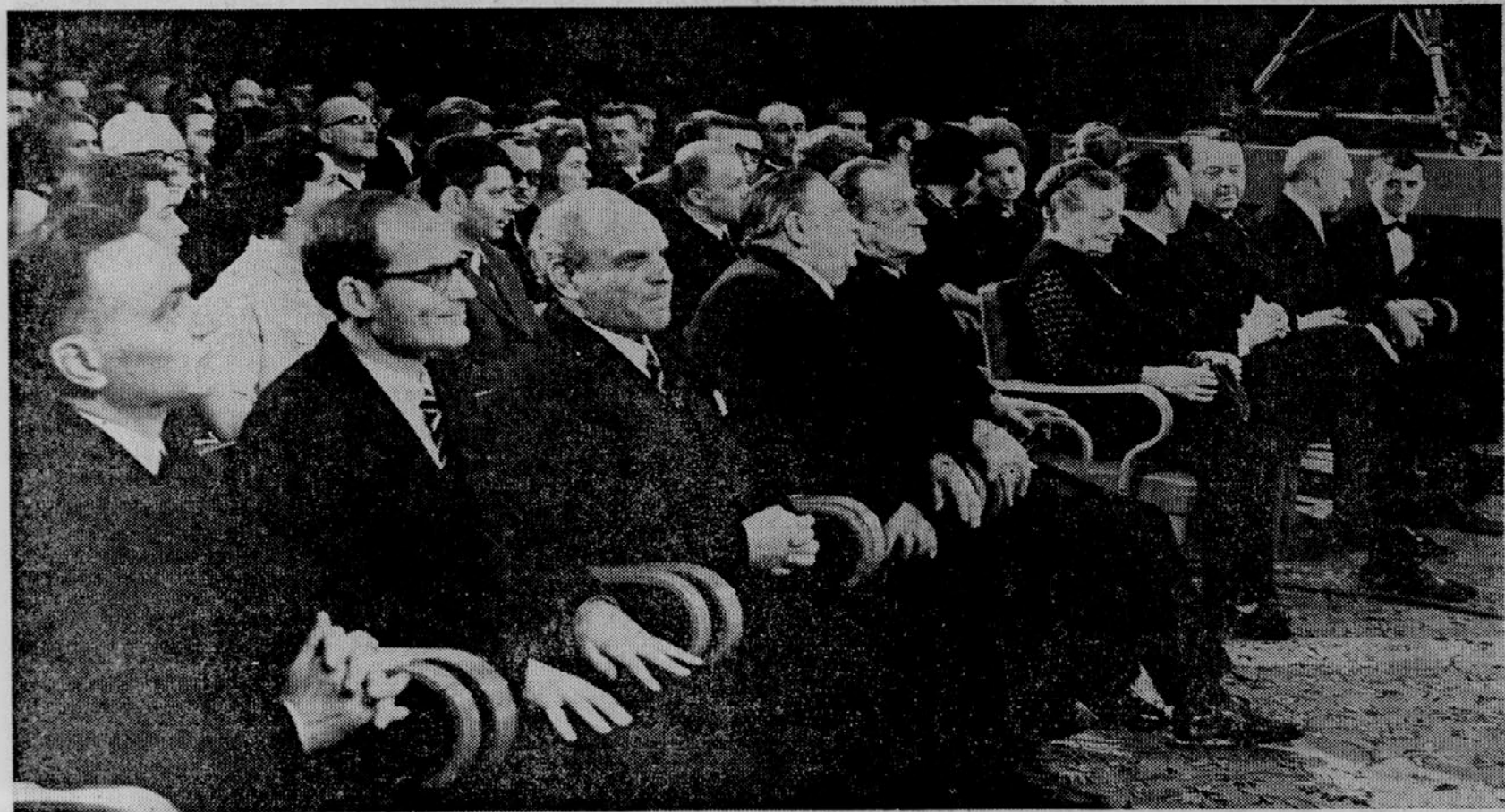
S SINOCNJE PODELITVE PREŠERNOVIH NAGRAD V DVORANI SLOVENSKE FILHARMONIJE.