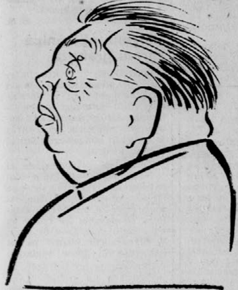
za razstavo v Mestni galeriji v Ljubljani leta 1968

Delo kiparja Lojzeta Dolinara predstavlja enega temeljnih kamnov slovenske sodobne plastike. V svojem umetniškem razvoju od leta 1911 dalje je že kmalu uveljavil nekatere prvine, ki so vtišile njegovemu delu enoten pečat. Preko odmevnih secesije po študiju na Dunaju in nekaterih elementov ekspresionizma se je kmalu uveljavil pri njem težnja po oblikovanju monumentalno zahtevne plastike. Po vojni ustvarja v smislu razgibanega realizma vrsto spomenikov, po letu 1956 pa se posveti s posebno ljubeznijo mali plastiki in smislu geometričnih oblik in linearne stilizacije. Po letu 1930 je živel v Beogradu in je precejšen del njegove likovne tvornosti nastajal v tem okolju, po drugi vojni pa mu je nove dru-