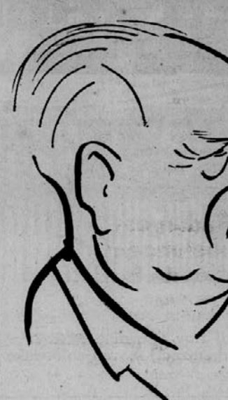
za življenjsko delo na področju glasbene ustvarjalnosti

Pahorjevi kompozicijski dosegki v instrumentalni glasbi so bili sprva uspešni in težnja, kakršno je zastopala Ostersveva šola. Med njegovimi najvažnejšimi skladbami tistega časa sta godalna kvarteta in nekatere pesmi. Po vojni je krenil na umirjenjša, vendar vsebinsko nič manj zahtevna pota. Uvajanje folklornih elementov, posebnost istrske motivike, zavezanost nekaterim drugim tipikom iz belokranjske in vzhodnoštajerske folklorne je bilo v našem instrumentalnem ustvarjanju nekaj novega. Njegov veliki dar za miniaturno oblikovanje je rodil na ožjem instrumentalnem področju nekaj izrednih skladb, med njimi Arabeske, Slovensko suito, nekaj izvrstnih sodobnih obdelav narodnih pesmi za instrument sam, ter odlične koncertne etude. Pahorjevo delovanje v NOB je dalo njegovi ustvarjalnosti nove pobude. Bil je med ustanovitelji partizanskega