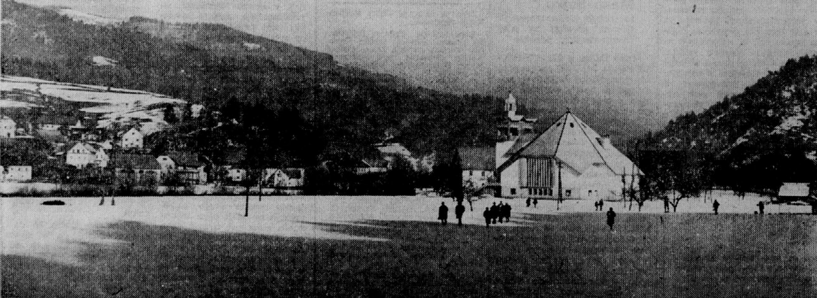
POLJANE NAD SKOPJO LOKO - Novjša sakralna arhitektura ne moti pokrajine in se lepo prilga okolju.

LAVRICA, 7. febr. - V Lavrici je osebni avtomobil zadrževal 750, ki ga je vozil Anton Drobnič, večkrat zjutraj ob 6.10 podrl 16-letnega Franca Porento, nato pa trčil še v snežni plug, ki je bil prijet k tovornjaku.