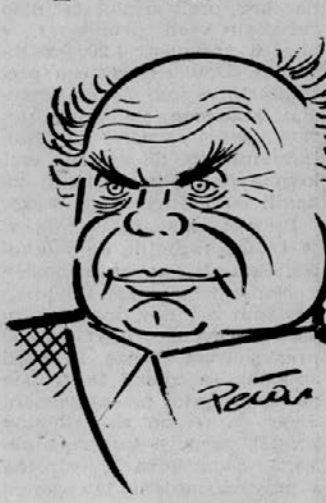
za arhitektonsko-urbanistično rešitev kompleksa Lucije