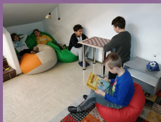
Šolski kotički 23