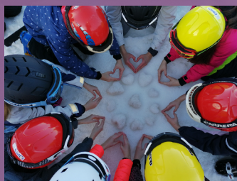
Zimska šola v naravi 8

Glasilo | Osnovna šola Ormož | številka 2 | 2018/2019