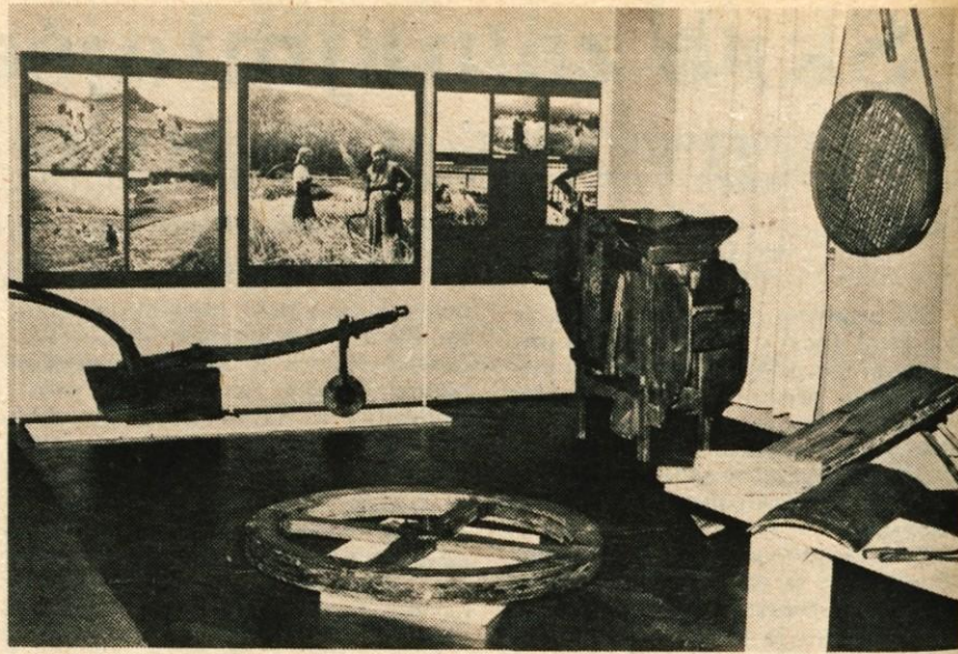
Gorenjski muzej v Kranju je pripravil izredno zanimiv etnografski prikaz z naslovom Kmečko gospodarstvo v Dolini. Otvoritev razstave je bila 30. oktobra popoldan v Mestni hiši. (-ig)