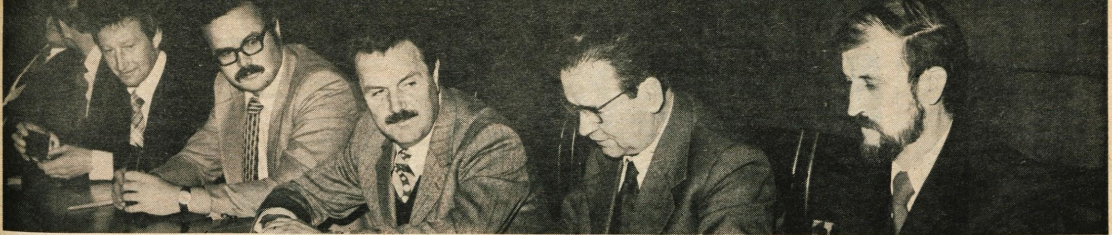
V začetku minulega tedna so predstavniki tovarne farmacevtskih in kemičnih izdelkov LEK iz Ljubljane in grafičnega podjetja Gorenjski tisk iz Kranja podpisali samoupravni sporazum o združitvi v sestavljeno organizacijo. Gorenjski tisk je že doslej tesno poslovno sodeloval z Lekom. V združenem podjetju bosta v prihodnje oba partnerja usklajevala proizvodni program, možnosti sodelovanja pa se kažejo tudi pri nabavi, uvozu, finančnih poslih in drugem. — A. Ž.