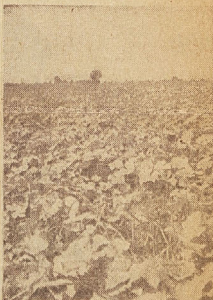
Namakana površina kumar — pridelek večji za 76%

Najštevilneje goje prašiče in to na vseh upravah pa tudi v gozdu pri gozd-