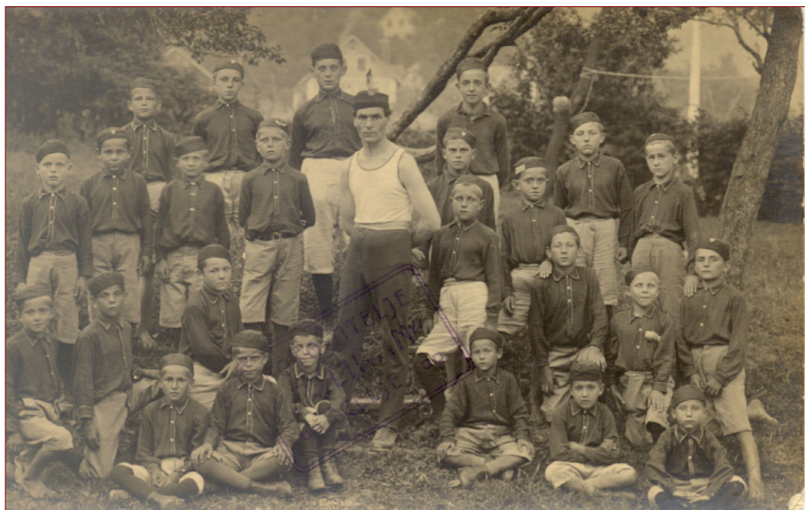
Slika 2: Naraščaj trboveljskega Sokola pred prvo svetovno vojno. 46

z naslovom »Svatba kralja Matjaža.« Na zabavo so povabili »vse napredne Trboveljčane in bližnje sosede Hrastničane in Zagorjane«, da s svojo udeležbo poplačajo trud trboveljskega društva. Vabilo se nadaljuje v šaljivem tonu: »Če pomislite, da pridejo to čarobno svatbo počastiti mnogi plemiči, odposlanci vseh narodov in sam Martin Krpan, potem tudi vi ne smete ostati doma za pečjo. Maske dobrodošle! Za vozove na postaji je skrbljeno. Na zdar!« 44 Na drugi strani se je solidarnost kazala z osnovanjem vadi- teljske blagajne in posebnega zletnega fonda, ki je omogočal udeležbo tudi manj premožnim članom društva. 45