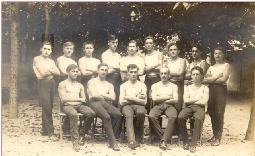
Slika 1: Moška vrsta Sokola pred prvo svetovno vojno. 35

organizacijo po vsem Slovenskem. 33 V načrtu pravil sokolske župe je bilo med drugim zapisano, da ima župa sedež v stalnem bivališču župnega staroste in da je njen namen » gojiti in širiti telesne vaje v povzdigo telesnih in nrvnih moči v slovenskem narodu, do vzajemne podpore zbliževati slovenska sokolska društva, združena v župi. « 34