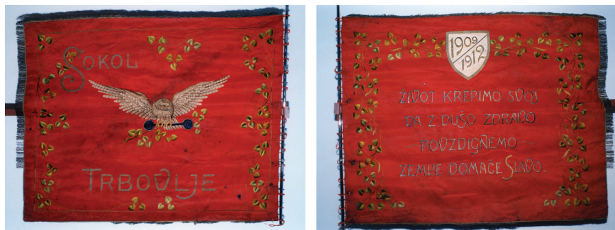
Sliki 5 in 6: Prapor trboveljskega Sokola – prednja in hrbtina stran.

Društveni praznik je osvetlil smisel za skupne akcije vseh narodno obrambnih društev in kot je dodal kronist trboveljskega Sokola: »Če je kdo do onega časa mislil, da Trbovlje niso slovenske, je moral ta dan priznati, da so in imajo krepko voljo take ostati še naprej.« 58