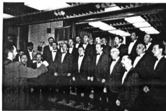
MPZ Svoboda Brestanica