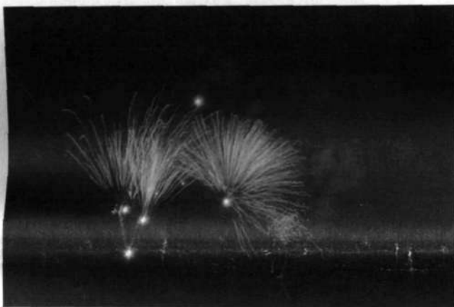
razstave kulinarike in ročnih del, občinski svetniki so se zbrali na slavnostni seji občinskega sveta v