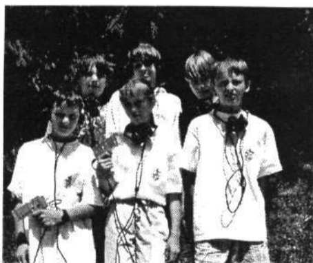
Pionirska ekipa radiokluba Krško