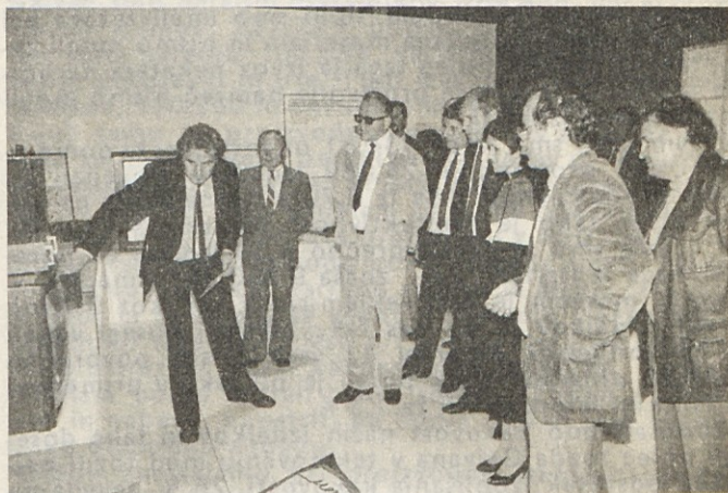
France Popit si je z zanimanjem ogledal hišni sejem.

Razstava dosežkov in ustvarjalnosti, prav tako pa tudi uspehi, ki jih dosegajo naši delavci v prizadevanjih za povečanje proizvodnje, produktivnosti in konvertibilnega izvoza pa so po mnenju tovariša