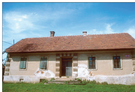
Hiša, Stari trg 11

Povzeto po interaktivni karti nepremične kulturne dediščine (Ministrstvo za kulturo RS), dosegljivi na http://giskd.situla.org Tatjana Vokić