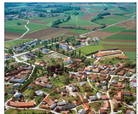
Veržej - trško naselje