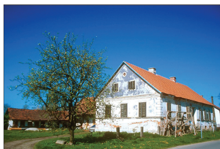
Domačija, Trg Slavka Osterca 1