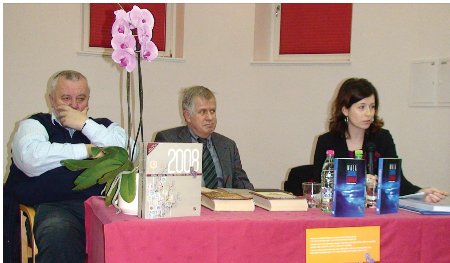
Večer z Mohorjevo družbo