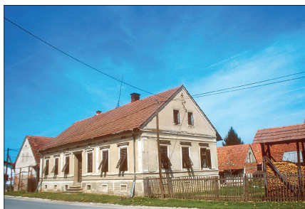
Domačija, Ulica Frana Kovačiča 2