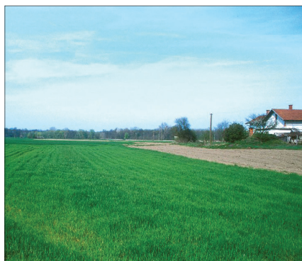
Prazgodovinska naselbina in ostanki rimske arhitekture