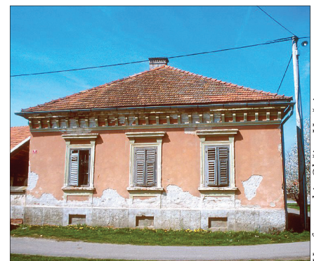
Domačija, Trg Slavka Osterca 9