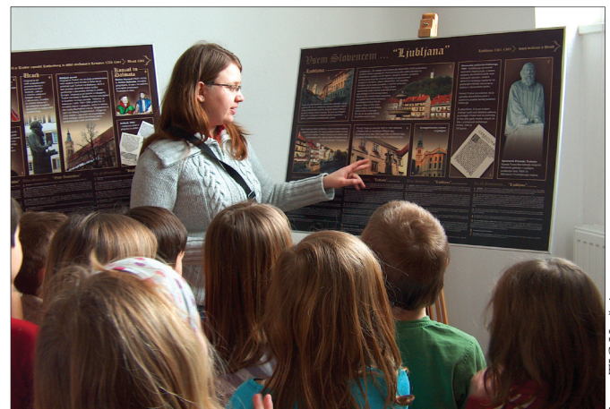
Vodeni ogled Trubarjeve razstave