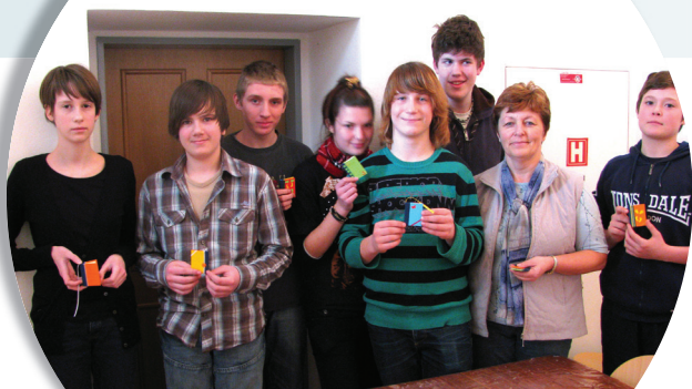
Delavnice knjigoveštva je obiskala tudi skupina nadarjenih učencev iz OŠ Ivana Cankarja Ljutomer.