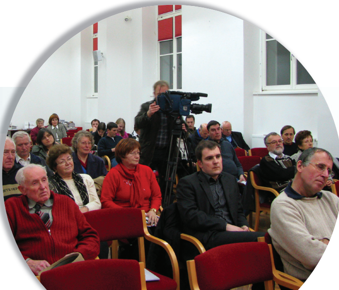
Dogodek je posnela tudi osrednja nacionalna TV hiša.