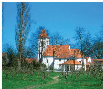
Cerkev svetega Mihaela