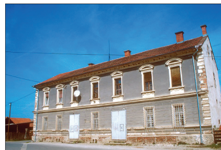
Hiša, Trg Slavka Osterca 1