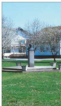
Spomenik Slavku Ostercu