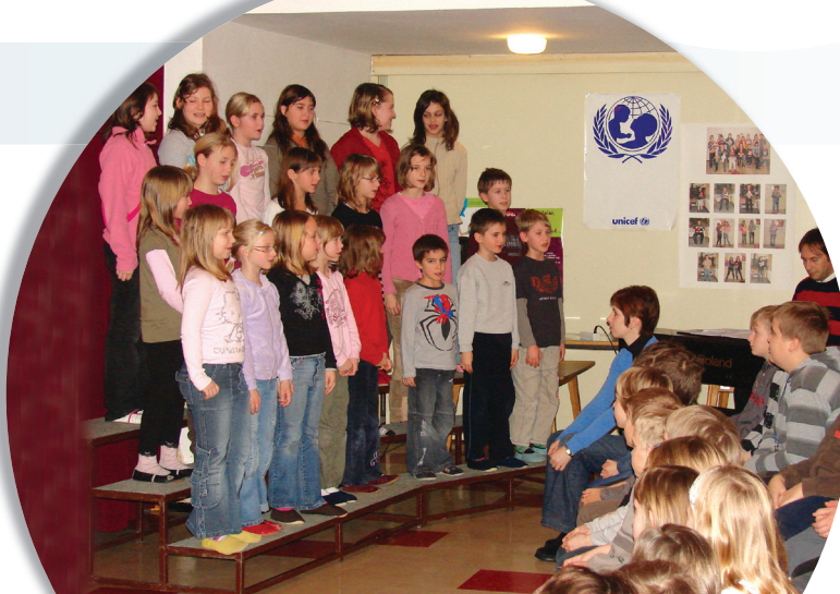
S priložnostnim programom so slovenski kulturni praznik počastili tudi učenci in učitelji OŠ Veržej.