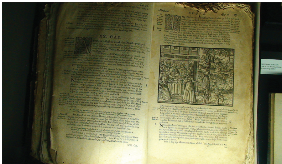
Potujoča razstava o Primožu Trubarju