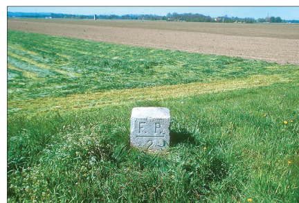
Mejni kamen št. 2