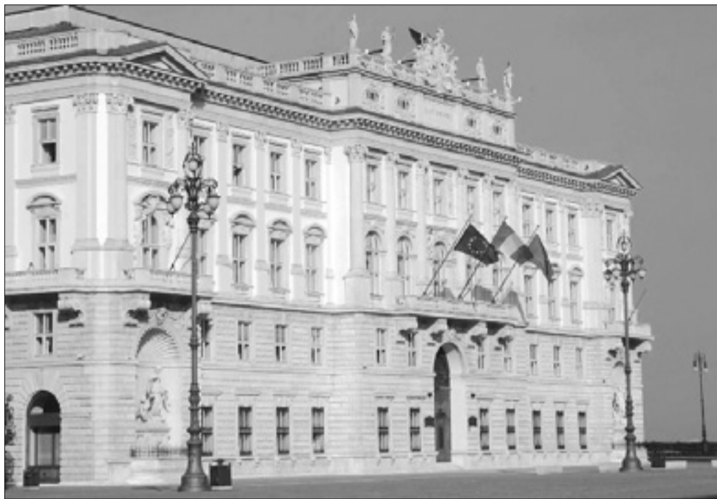
Kdo bo zasedal odborništva v novi deželni vladi, še ni znano

Tondo: Odločam jaz - Za uravnoveženost deželne vlade