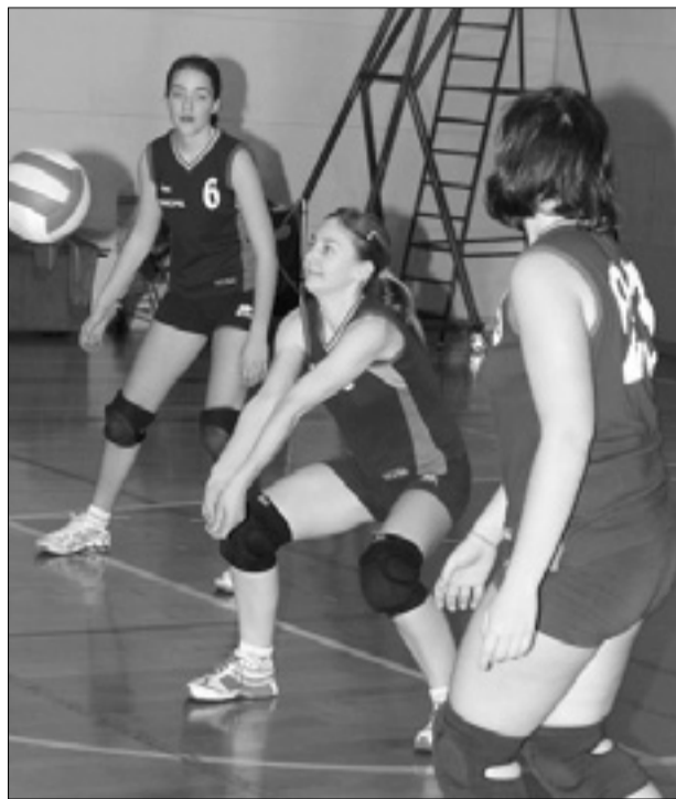
Kontovelke danes ob 19.30 v finalu proti Virtusu

Prva finalna tekma za tretje mesto se je v nedeljo v Tržiču končala z zmago domače ekipe, osvojeni set pa dopušča slogašem še upanje, da prihodnja nedeljo na domačih tleh obrnejo rezultat v svojo korist. Srečanje je bilo zanimivo in izenačeno, glavni adut domačinov pa je bil neustavljivi napadalec Gastaldo, ki je tudi član deželne reprezentance. Sloga, ki je tudi tokrat nastopila brez Iliča, je bila nekoliko premalo prodorna v napadu, kar je bila prav gotovo posledica tokrat res zelo povprečne igre v