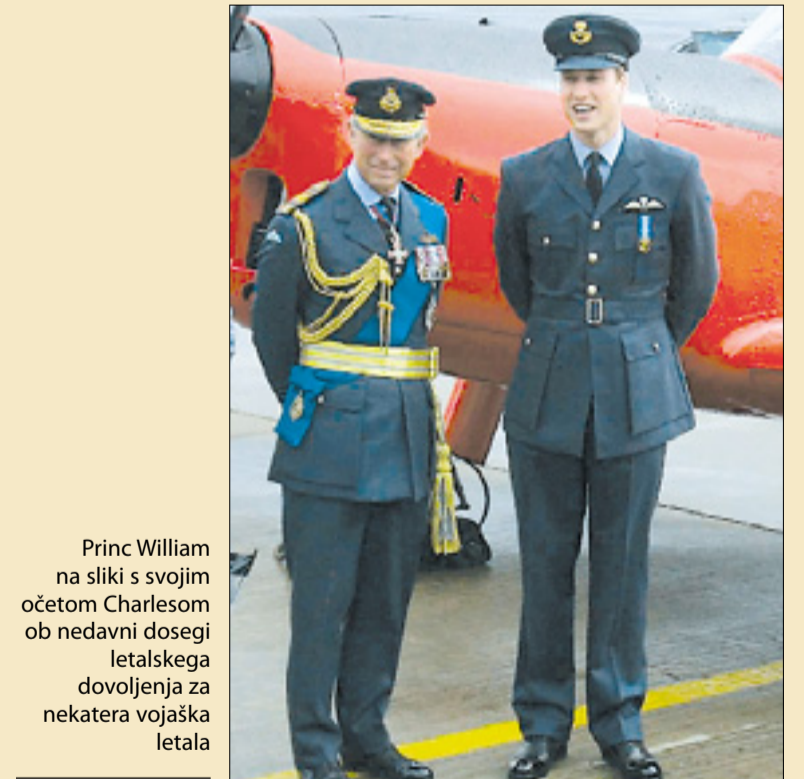
Princ William na sliki s svojim očetom Charlesom ob nedavni doseg letalskega dovoljenja za nekatera vojaška letala

LONDON - Britanski princ William je z vojaškim helikopterjem pristal v vrtu svoje spremljevalke Kate Middleton, je včeraj pisal britanski News of the World. Z britanskega obrambnega ministrstva so sporočili, da so mu pristaneke odobrili v okviru rutinskega urjenja in pojasnili, da se morajo piloti za posredovanje v Iraku in Afganistanu uriti na majhnih površinah. Helikopter je na vrtu Middletonovih pristal 3. aprila za 20 sekund, nihče pa ni izstopil iz njega ali vstopil vanj. Manever princa Williama so opazovali njegova 26-letna izvoljenka in njeni starši. Vojaški strokovnjaki so Williamovo ravnanje kritizirali kot "popolno potrato vadbeneh ur letenja", ki si jih vojska sicer le stežka privošči. Princ William se je zaradi uporabe vojaškega helikopterja v zasebne namene v medijih znašel že prejšnji teden, ko je iz Londona letel na otok Wight na fantovščino svojega prijatelja. Po navedbah britanskega obrambnega ministrstva je šlo tudi v tem primeru za urjenje. (STA)