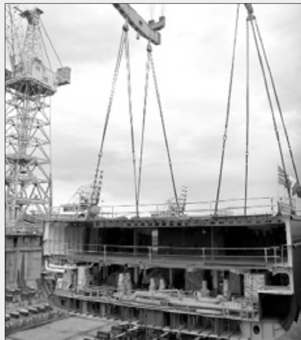
Orjaški žerjavi v tržiški ladjedelnici

Zaradi zaskrbljujočega porasta števila nesreč so sindikalne organizacije za današnji dan sklicale enourno stavko