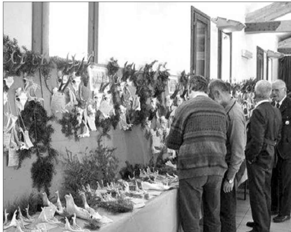
Jamelska razstava lovskih trofeje