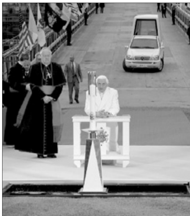
Papež pred obeležjem atentatov 11. septembra '01 v New Yorku

Med izstopajočimi trenutki obiska poglavarja 1,1 milijarde rimokatolikov po vsem svetu so bili še obisk prizorišča terorističnih napadov v ZDA 11. septembra 2001 v New Yorku in nastop pred Generalno skupščino ZN. Pri tem je Benedikt XVI. med drugim države pozval, naj svoje državljane zaščitijo pred resnimi in trajnimi kršitvami človekovih pravic. Papeža, ki je med obiskom v ZDA dopolnil 81. rojstni dan, je v Beli hiši sprejel tudi ameriški predsednik George Bush. (STA)