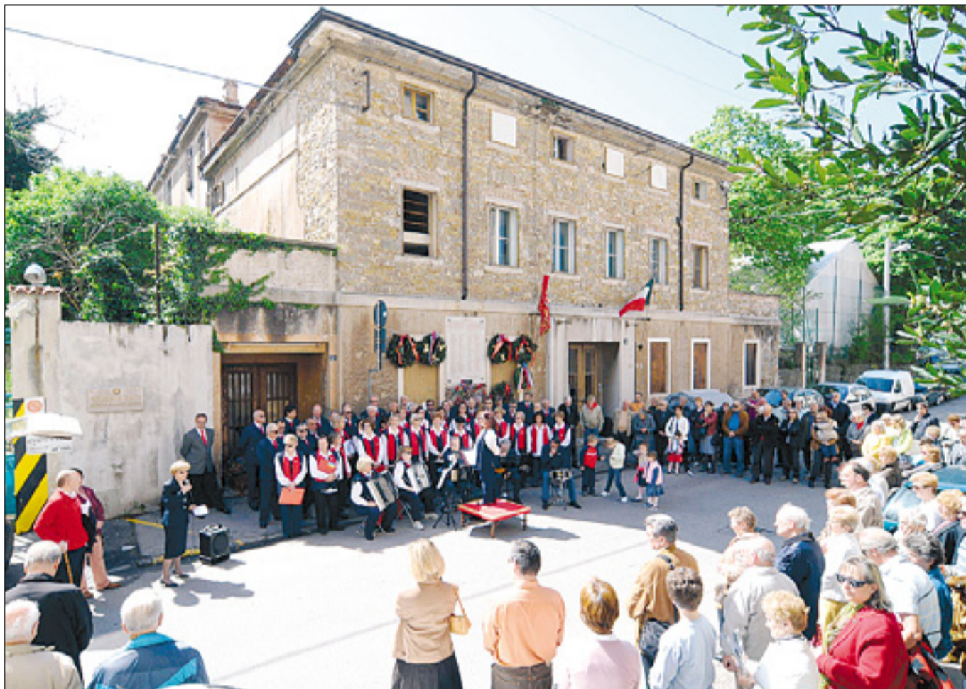
Z nedeljske proslave pred svetoivanskim Narodnim domom