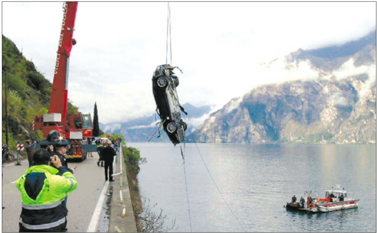
Ponesrečeni aston martin vlečejo iz voda Gardskega jezera