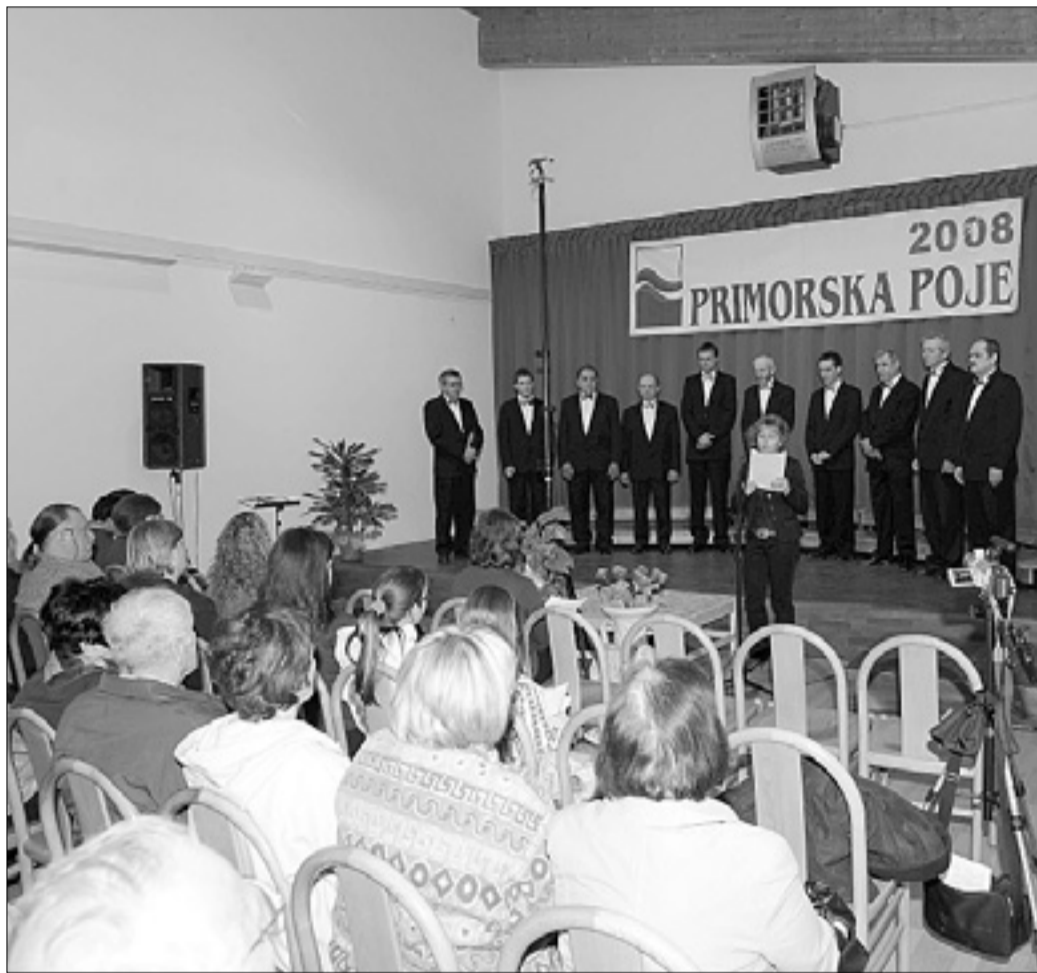
Tudi letošnja pevska revija Primorska poje gre h koncu

Nastopilo je šest zborov iz Slovenije in eden iz Hrvaške