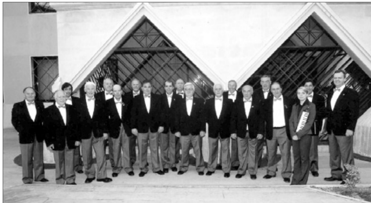
Moški pevski zbor Tabor z Opčin

Openske pevce je gostilo pevsko društvo Slavec iz Solkana - To so bili prvi stiki, zbora pa že načrtujeta novo srečanje na Opčinah