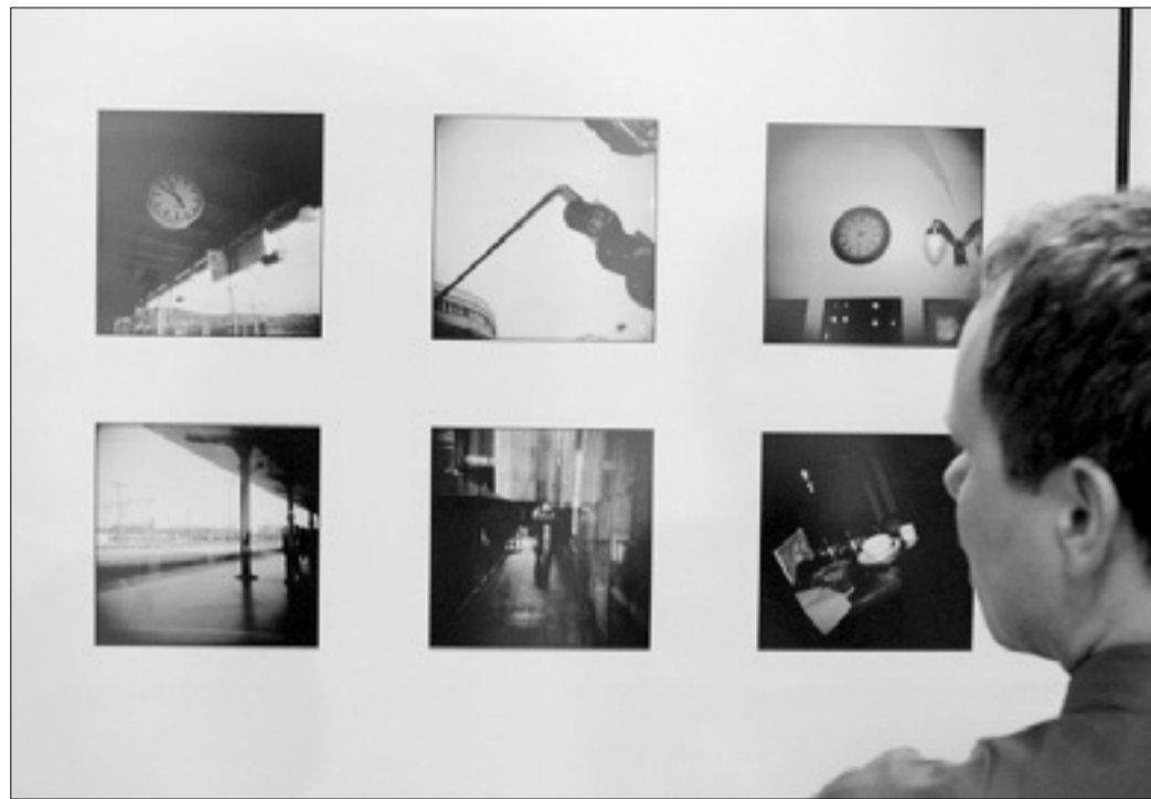
Skupinska razstava bo v Kulturnem domu na ogled do 23. maja