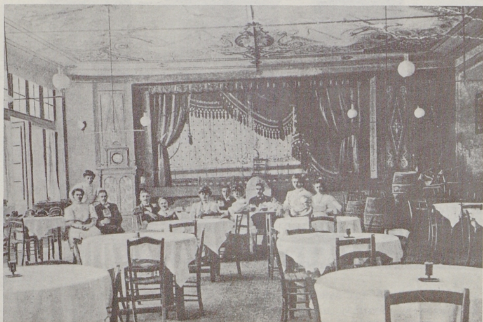
Gledališka dvorana Narodnega doma v Barkovljah