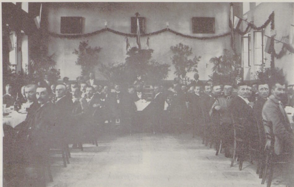
Z otvoritve svetoivanskega Narodnega doma 5. jun. 1903