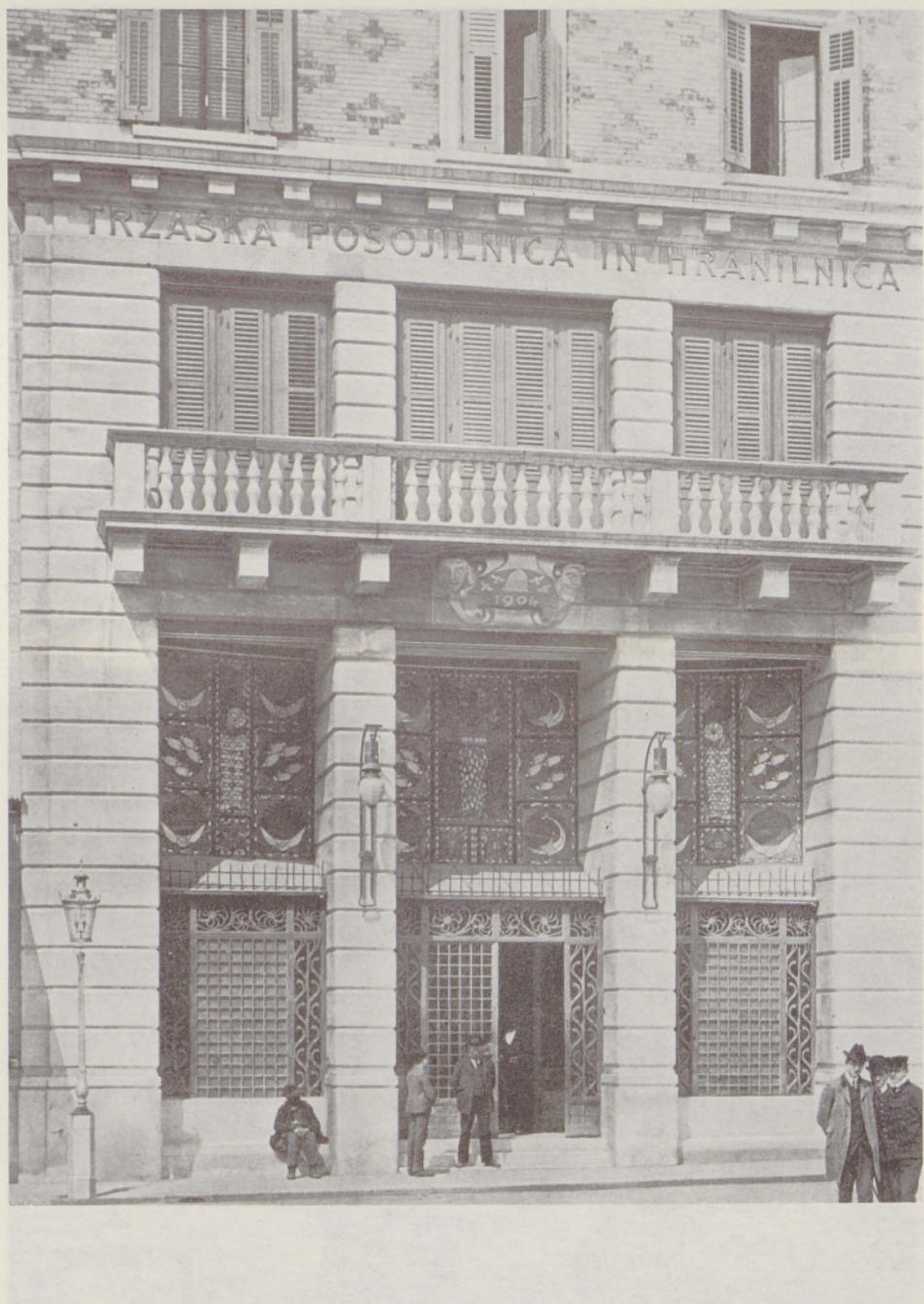
Del pročelja Narodnega doma v Trstu.