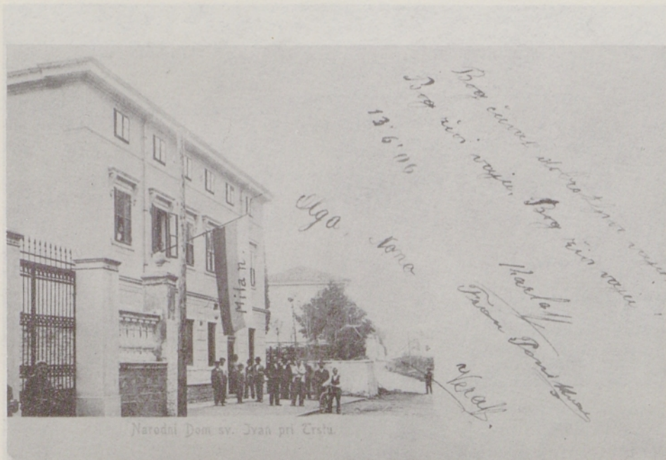
Narodni dom pri Sv. Ivanu