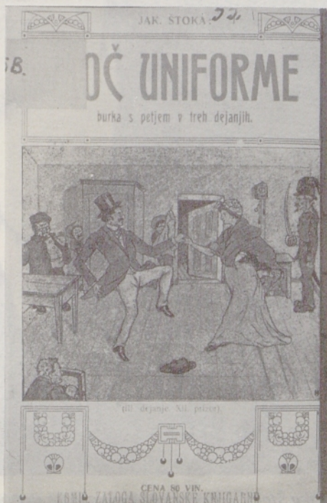
Naslovna stran Štokove knjige