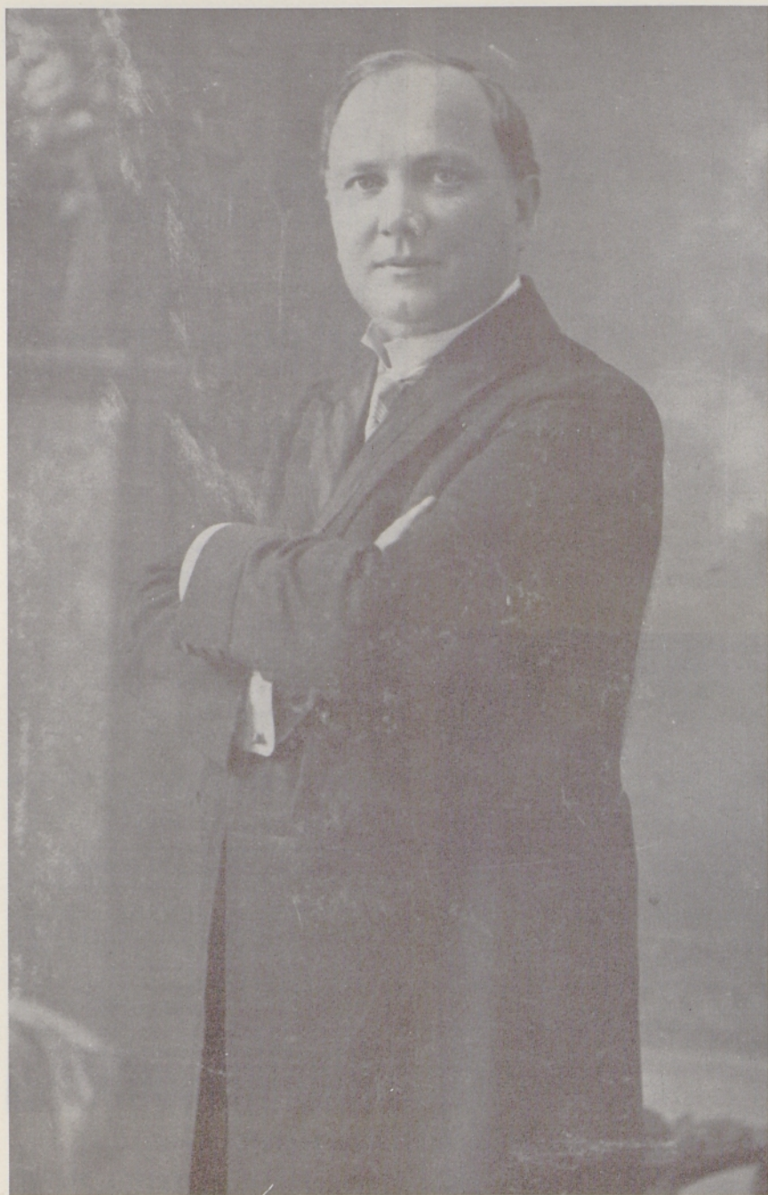
Anton Verovšek je bil prvi režiser poklicnega gledališča v Trstu