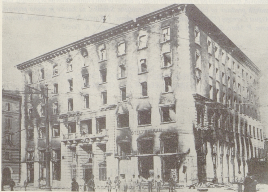
Poslopje Narodnega doma po 13. juliju 1920