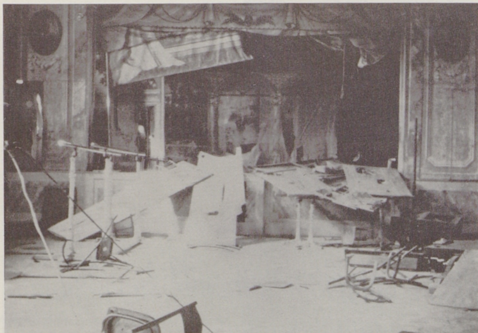
Dvorana istega doma po fašističnem napadu 2. sept. 1921.