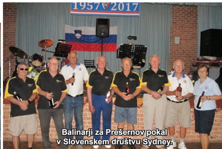
Balinarji za Prešernov pokal v Slovenskem društvu Sydney.