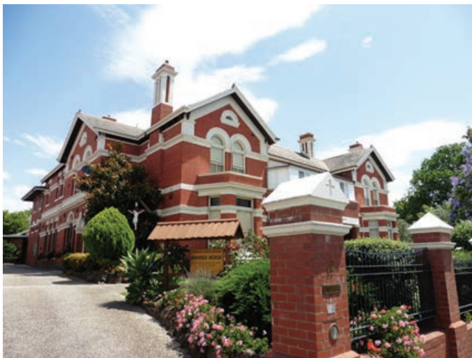
Baragov dom - Baraga House, sedež slovenskega misijona v Melbournu.

30. junija 2018 se bo ob 7.00 v okviru Baragovih dni začel pohod po Baragovi poti od župnijske cerkve v Trebnjem (izpred