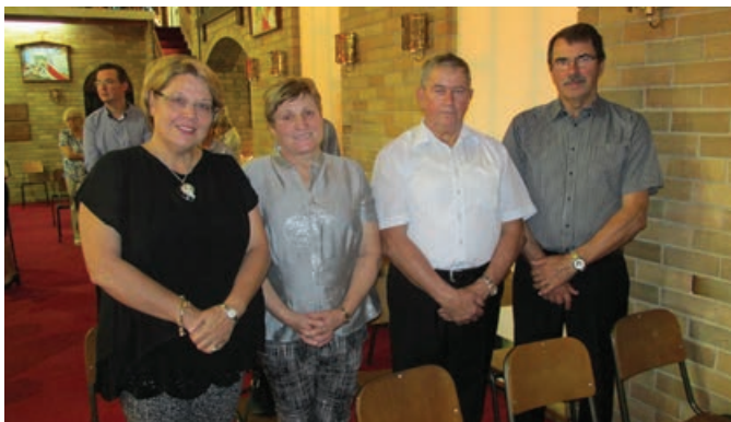
Lahovi so imeli obiske iz Slovenije.