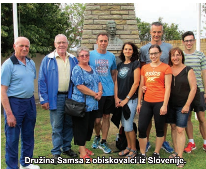
Družina Samsa z obiskovalci iz Slovenije.

zapeli zbirko priljubljenih pesmi v vsaj štirih jezikih, nakar so se vrnili na balinarske steze za tretjo igro in potem za finale med štirimi najboljšimi skupinami