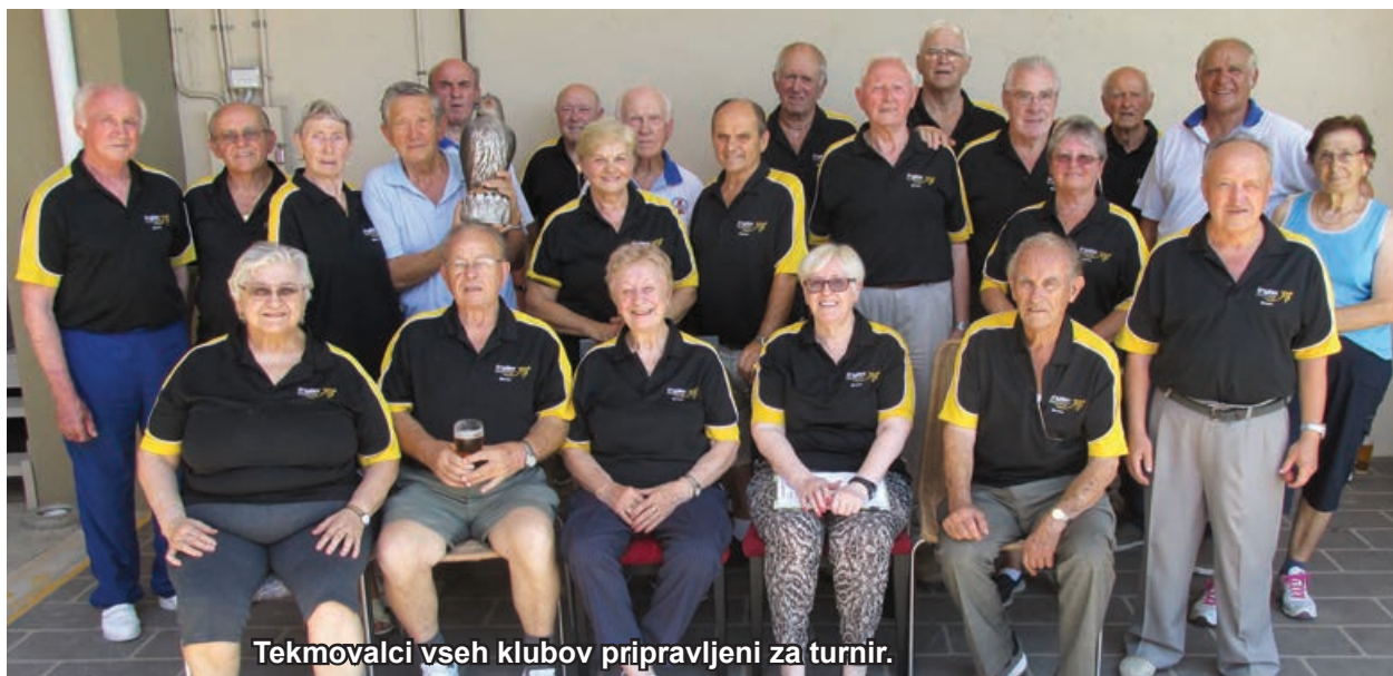
Tekmovalci vseh klubov pripravljeni za turnir.

Dan Samostojnosti Republike Slovenije. Podelitev priznanj Slovenske Skupnosti za leto 2018. Za ples igra ansambel Alpski Odmevi .