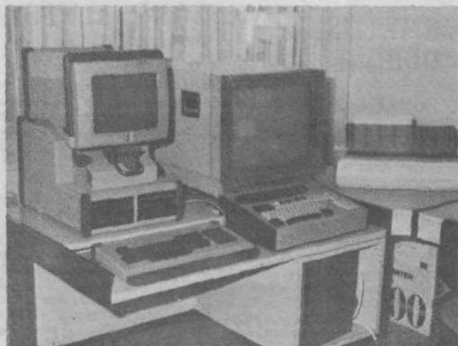
Procesno vodenje vodovodnega sistema Grosuplje.

Društvo za cerebralno paralizo Grosuplje