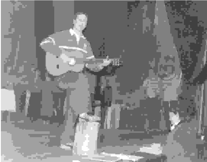
Vaje so v polnem teku in priprave lepo napredujejo

- Skupaj bo nad šestdeset igralcev. Od Martina Fierro pa do zadnjega gavča, vsaka podoba na odru je iz originalne pesnitve. Nobena oseba ni bila izključena, pa čeprav ima vloga le nekaj besed. Zato je velika zasluga tistih igralcev, ki sodelujejo pri igri morda le s kratkim nastopom. Celotnemu delu dodamo dva plesa, ki obogatita dinamiko in življenje igre. Pokažemo, da so se gavči v pulperijah tudi veselili, vsaj v tistem prvem obdobju. Nastopa 18 parov, torej skupaj 36 plesalcev, s čimer postavimo na oder nad 90 oseb. Vendar tako plesi kot spopadi niso spektakel zase ampak so bistveni deli igre, kjer vse poteka v eni sami enoti.