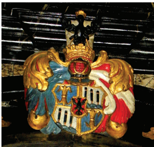
Grb rodbine Zanetti v cerkvi sv. Jakoba v Škofji Loki.