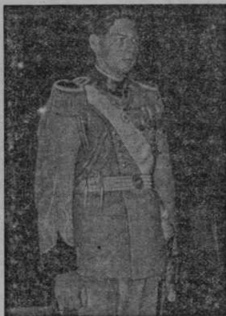
Novi romunski kralj Mihael