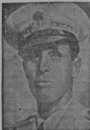
Vojevoda Aosta, poveljnik Italijanske armade v zasedeni angleški Somaliji

Ljutomer. Nastopilo je nekoliko boljše vreme, kar je tudi potrebno, če hočemo, da bo dozorela ajda in koruza. Ljudje že kopljejo krompir. Ne-