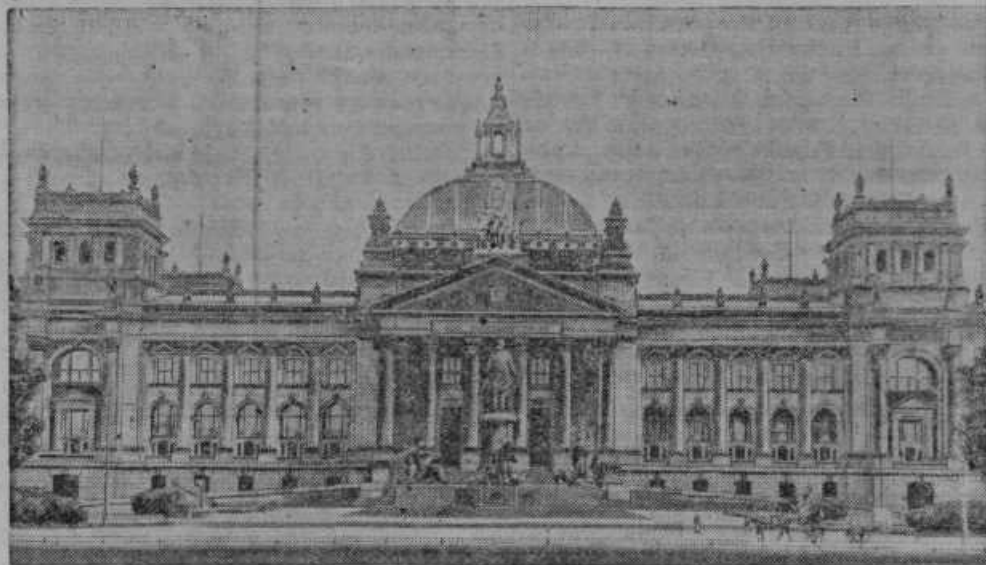
Nemški državni zbor v Berlinu. — Poročajo, da ga je zadela angleška bomba