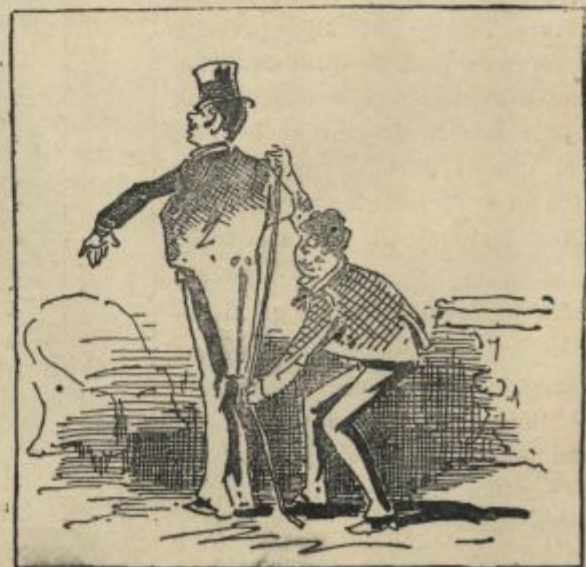
A.: „Ali mi je frak dosti dolg?“ B.: „Frak je dolg, a Vaš dolg je še daljši.“