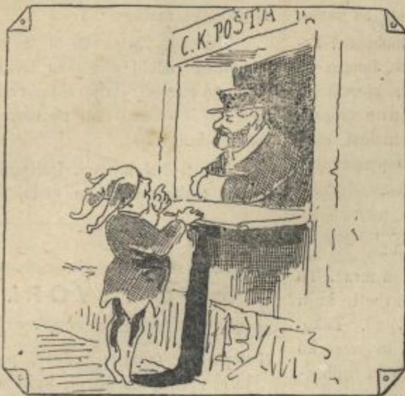
„Ali ni nič nakaznic za „Škrata“?“