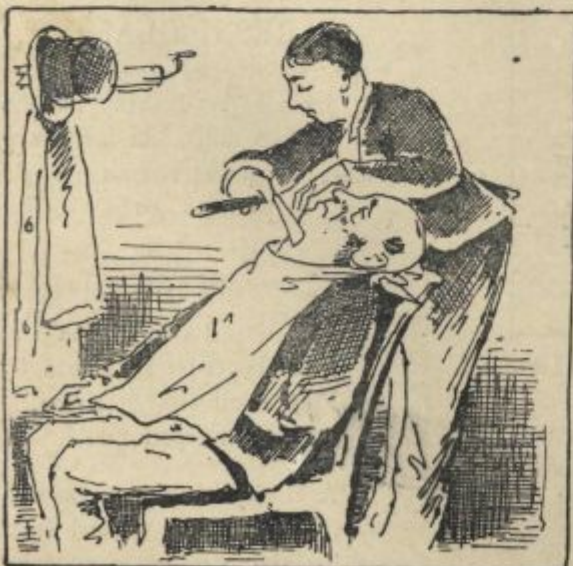
A.: „Želite, da Vam lase žgem?“ B.: „Prosim! Ako mogoče“.