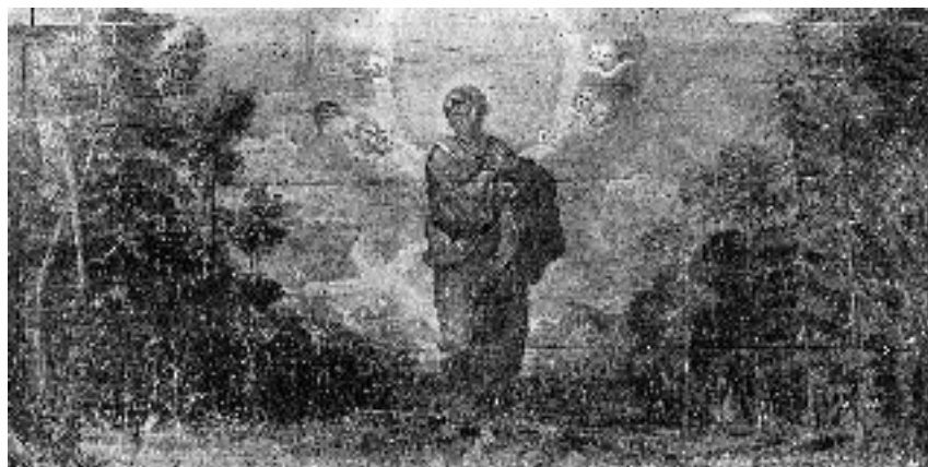
1. Sv. Peter , antependij stranskega oltarja sv. Petra, podružnična cerkev sv. Volbenka v Logu nad Škofjo Loko, 1694