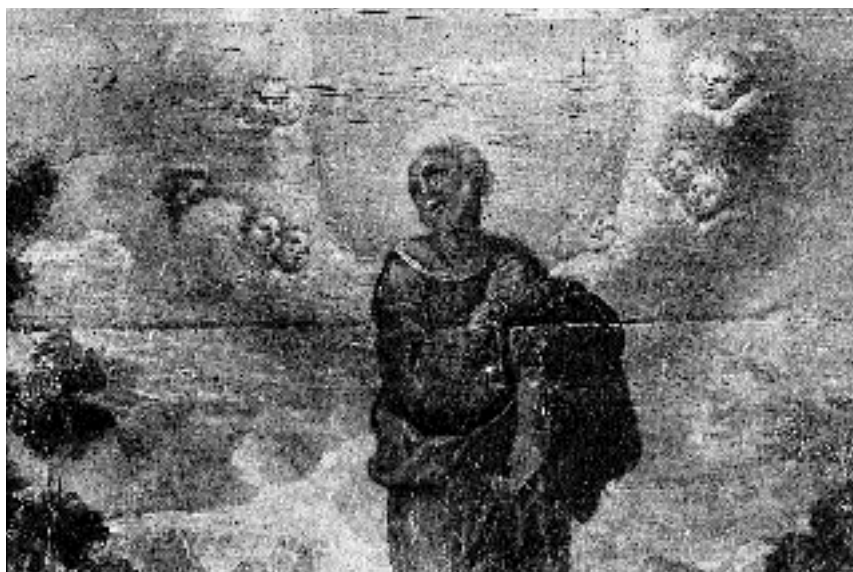
3. Sv. Peter , antependij stranskega oltarja sv. Petra, podružnična cerkev sv. Volbenka v Logu nad Škofjo Loko, 1694, detajl