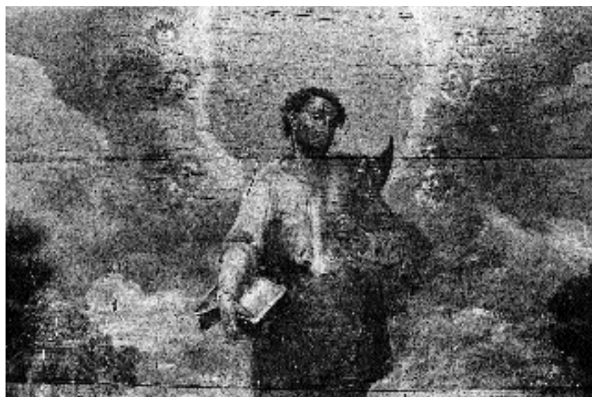
4. Sv. Matija , antependij stranskega oltarja sv. Pavla, podružnična cerkev sv. Volbenka v Logu nad Škofjo Loko, 1694, detajl