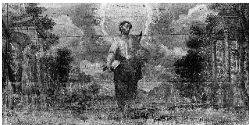
2. Sv. Matija , antependij stranskega oltarja sv. Pavla, podružnična cerkev sv. Volbenka v Logu nad Škofjo Loko, 1694