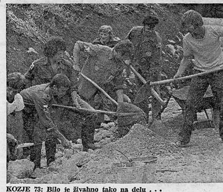
KOZJE 73: Bilo je živahno tako na delu...

Lanska akcija in letošnje nadaljevanje kažeta, kako je lahko pot lahko uspešna. In prepričani smo, da bodo podobno pot ubrale tudi OK ZMS širom Slovenije.